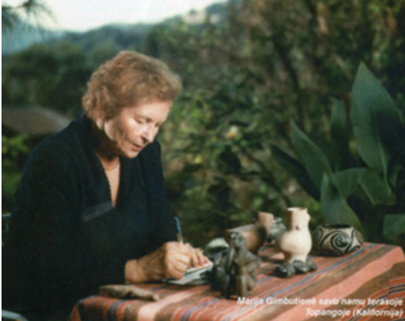
Marija Gimbutienė savo namų terasoje Topangoje (Kalifornija)