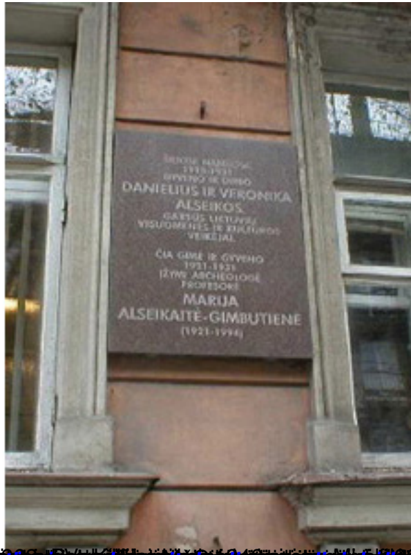
Draugė Marija Gimbutienė. Archėologijos pradininkė ir šalininkė