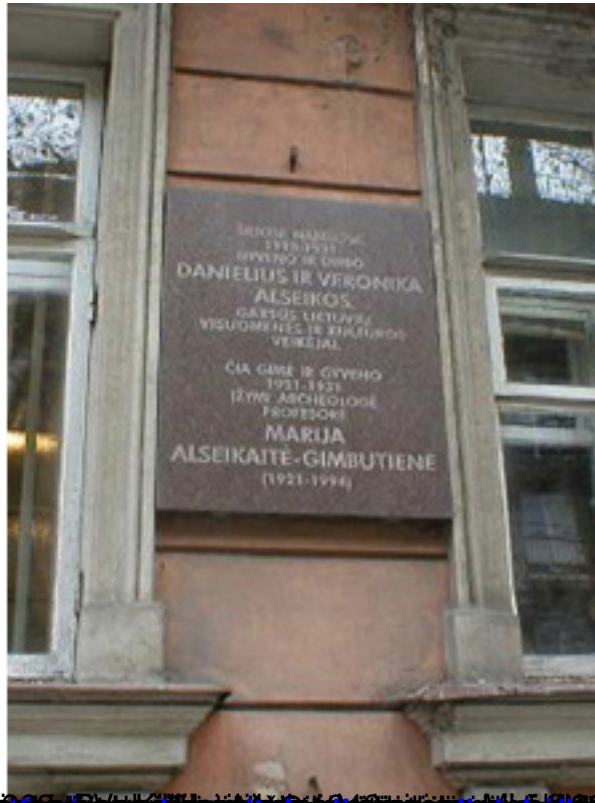
Draugė Marija Gimbutienė. Archeologijos pradininkė ir šalininkė