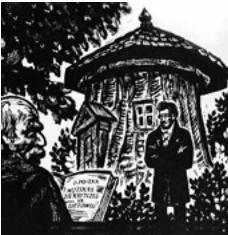
Dionizas Poška ir Baublys

XVI amžiaus istorikas Motiejus Strykovskis „Lenkijos, Lietuvos, Žemaičių ir visos Rusios kronikoje“ ap