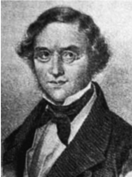
Frederikas Diubua de Monperé

XIX amžiaus pirmoje pusėje archeologinius kasinėjimus vykdė prancūzas Frederikas Diubua de Monperé