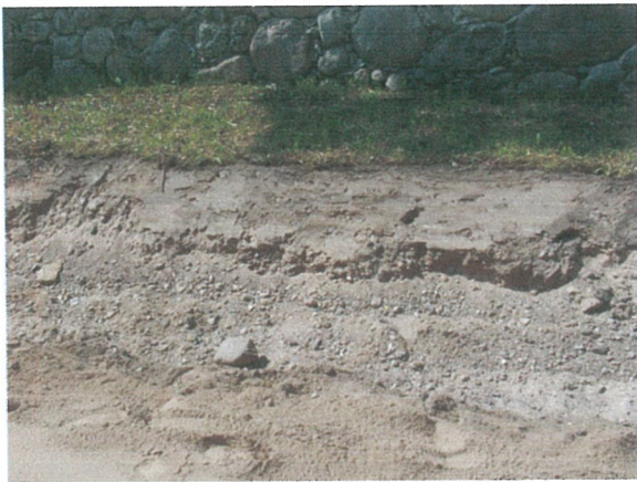
21. 2-oji šaligatvio atkarpa iš R pusės (141-143 m)