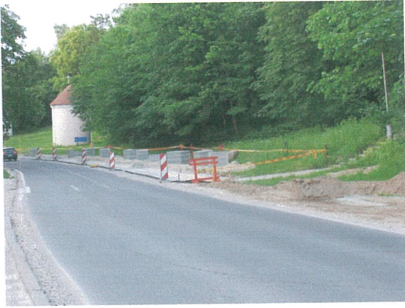
5. 1-oji šaligatvio atkarpa iš P pusės