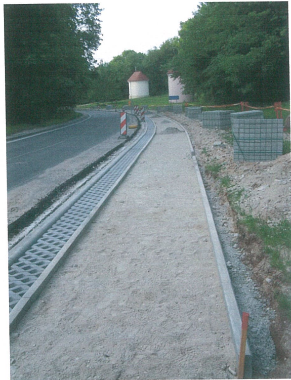
6. 1-oji šaligatvio atkarpa iš P pusės