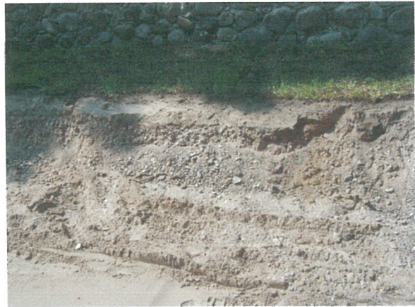
20. 2-oji šaligatvio atkarpa iš R pusės (138-140 m)