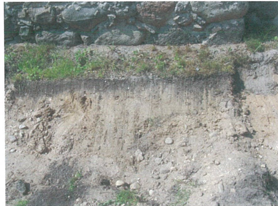
48. 2-oji šaligatvio atkarpa iš R pusės (222-224 m)