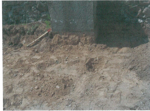
38. 2-oji šaligatvio atkarpa iš R pusės (192-194 m)