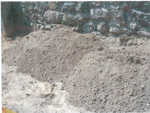
39. 2-oji šaligatvio atkarpa iš R pusės (195-197m)