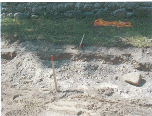
23. 2-oji šaligatvio atkarpa iš R pusės (147-148 m)