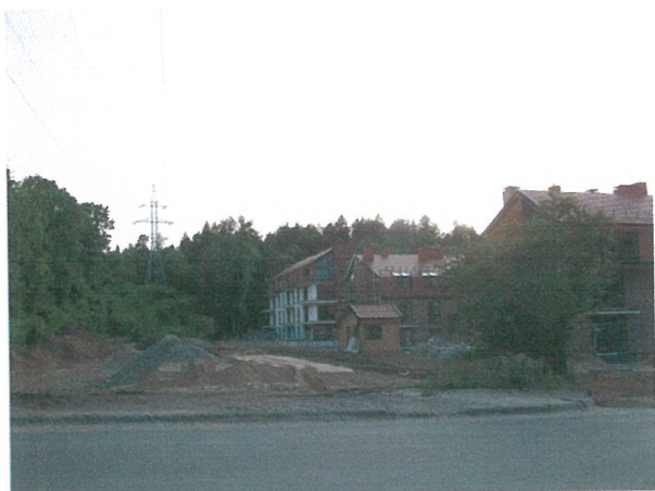
9. Naujai kuriamas namų kvartalas iš R pusės (Verkių g. 68)