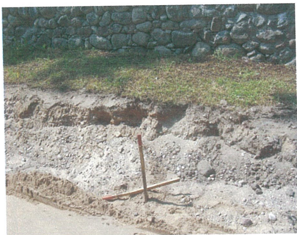
25. 2-oji šaligatvio atkarpa iš R pusės (153-155 m)