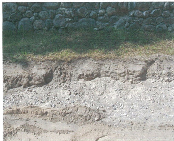
24. 2-oji šaligatvio atkarpa iš R pusės (150-152 m)