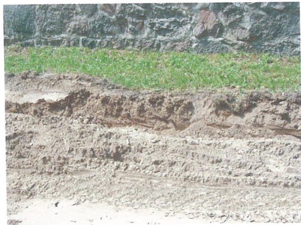
32. 2-oji šaligatvio atkarpa iš R pusės (174-176 m)