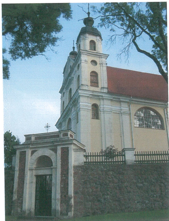
3. Trinapolio bažnyčia iš Š pusės, 2007 m.