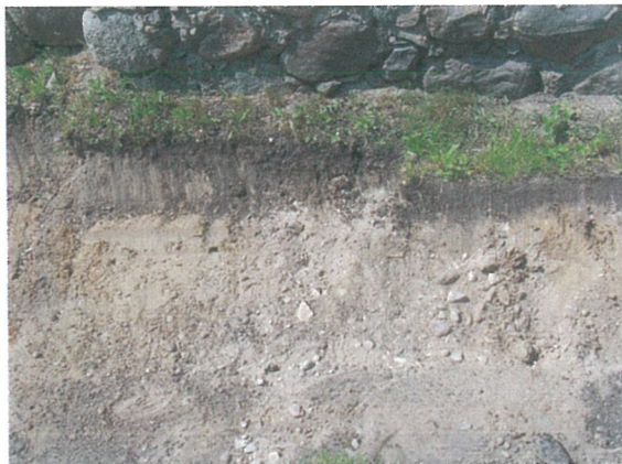
47. 2-oji šaligatvio atkarpa iš R pusės (219-221m)