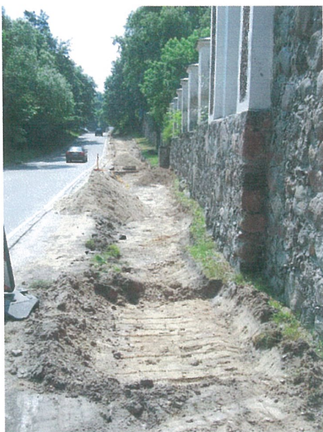
13. 2-oji šaligatvio atkarpa iš Š pusės