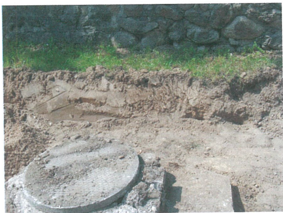
35. 2-oji šaligatvio atkarpa iš R pusės (183-185 m)