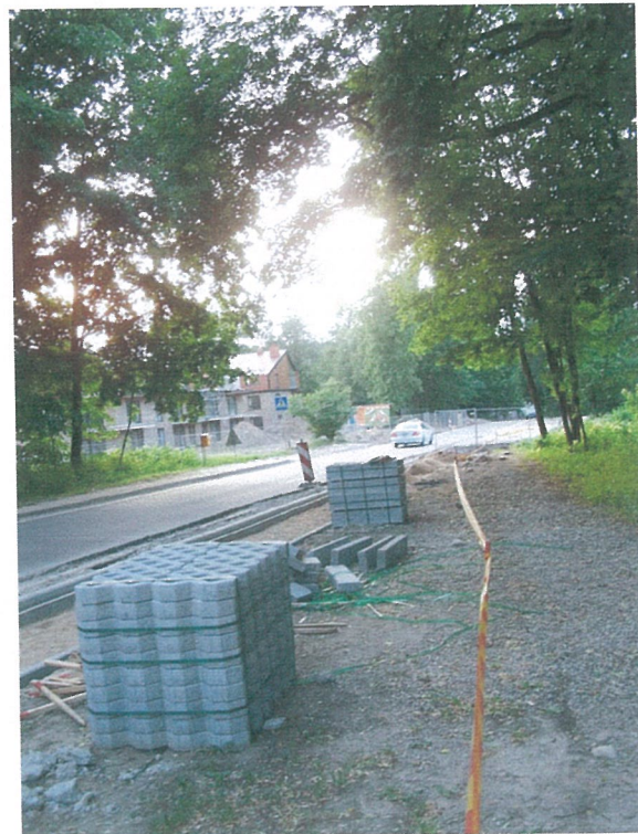
8. 1-oji šaligatvio atkarpa iš P pusės