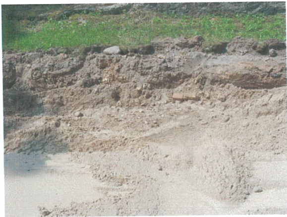
31. 2-oji šaligatvio atkarpa iš R pusės (171-173 m)