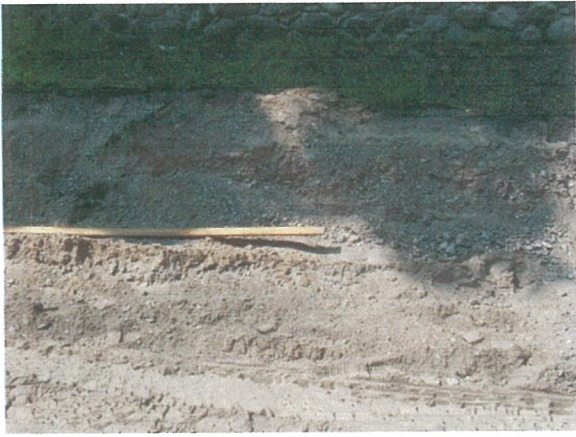
19. 2-oji šaligatvio atkarpa iš R pusės (135-137 m)