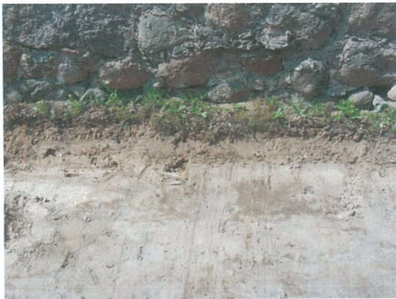
41. 2-oji šaligatvio atkarpa iš R pusės (201-203 m)