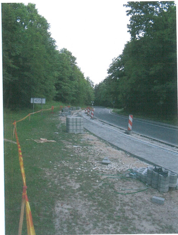
7. 1-oji šaligatvio atkarpa iš Š pusės