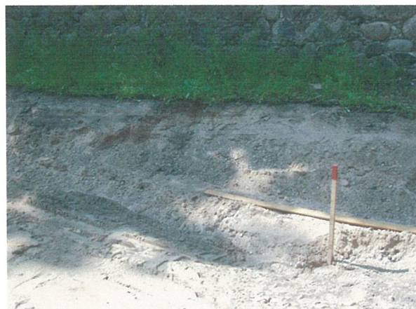
18. 2-oji šaligatvio atkarpa iš R pusės (132-134 m)