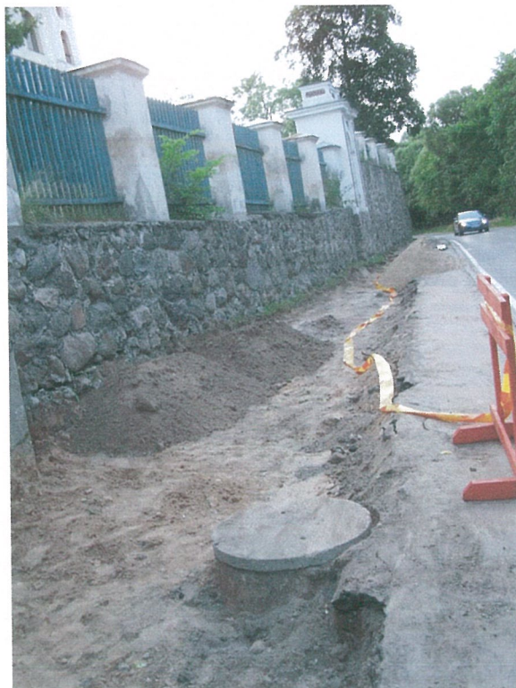
12. 2-oji šaligatvio atkarpa iš P pusės