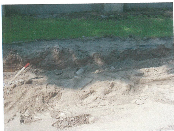
29. 2-oji šaligatvio atkarpa iš R pusės (165-167 m)