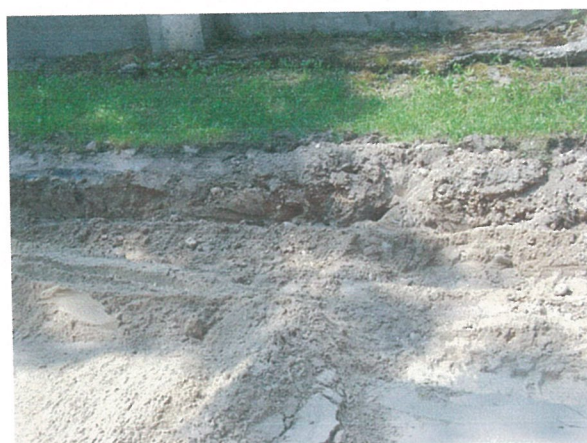
30. 2-oji šaligatvio atkarpa iš R pusės (168-170 m)