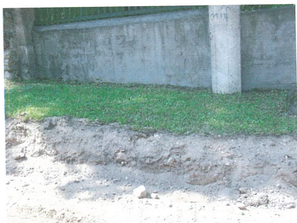
27. 2-oji šaligatvio atkarpa iš R pusės (159-161 m)