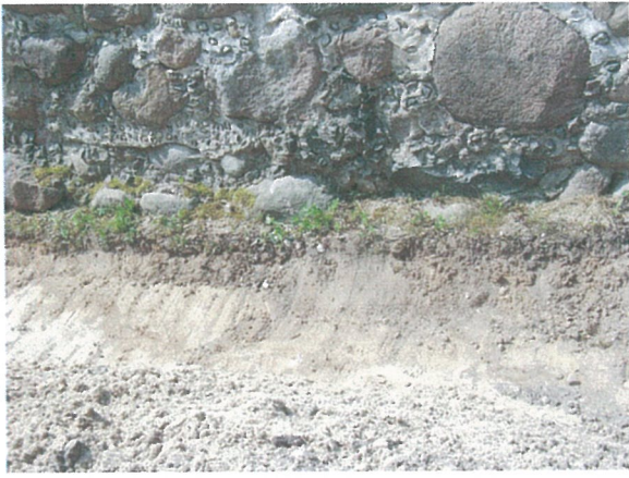
43. 2-oji šaligatvio atkarpa iš R pusės (207-209 m)