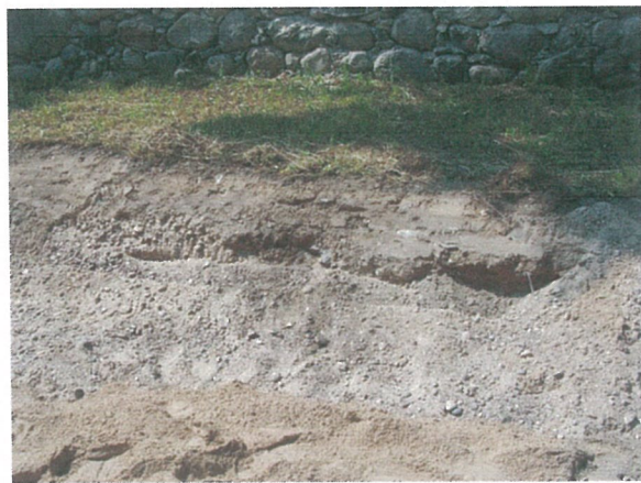
22. 2-oji šaligatvio atkarpa iš R pusės (144-146 m)