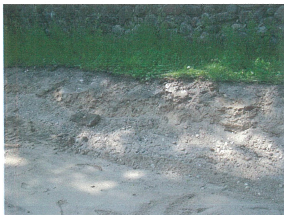
17. 2-oji šaligatvio atkarpa iš R pusės (129-131 m)