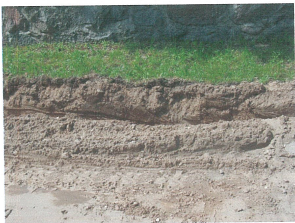
33. 2-oji šaligatvio atkarpa iš R pusės (177-179 m)