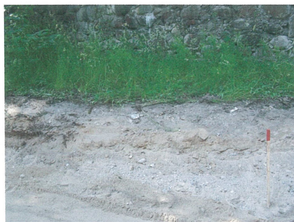
16. 2-oji šaligatvio atkarpa iš R pusės (126-128 m)