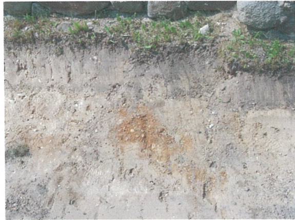
46. 2-oji šaligatvio atkarpa iš R pusės (216-218 m)