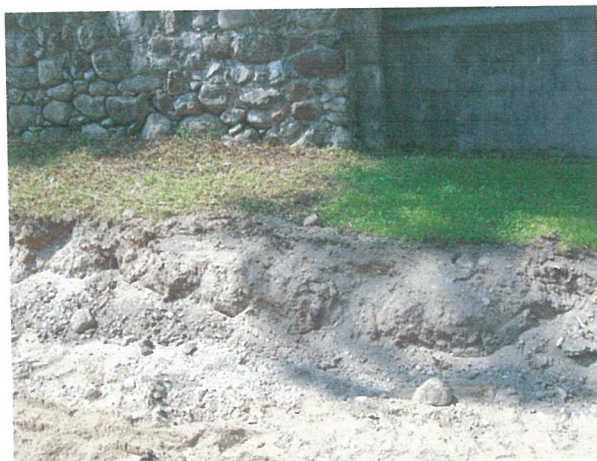
26. 2-oji šaligatvio atkarpa iš R pusės (156-158 m)