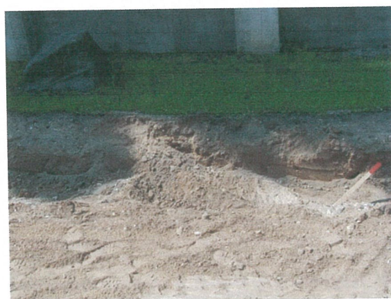
28. 2-oji šaligatvio atkarpa iš R pusės (162-164 m)