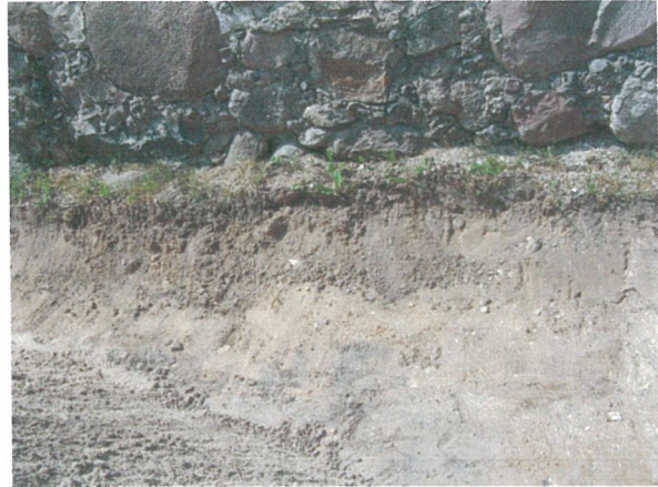
44. 2-oji šaligatvio atkarpa iš R pusės (210-212 m)