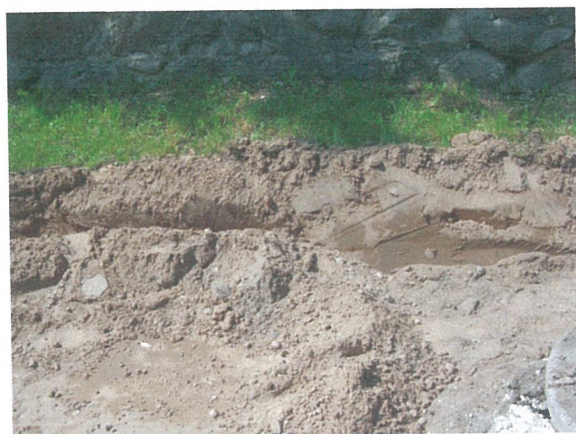
34. 2-oji šaligatvio atkarpa iš R pusės (180-182 m)