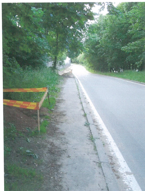
10. 2-oji šaligatvio atkarpa iš P pusės