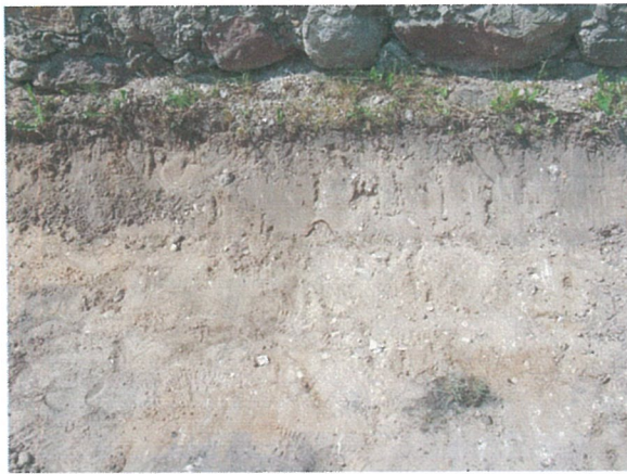
45. 2-oji šaligatvio atkarpa iš R pusės (213-215 m)