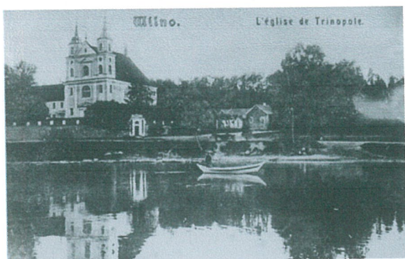
1. Trinapolio bažnyčia. Teodor Pientka (VAA, F. 5, b. 6560)