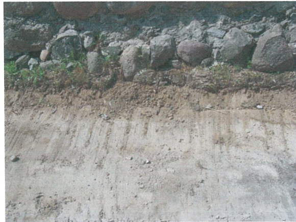
42. 2-oji šaligatvio atkarpa iš R pusės (204-206 m)