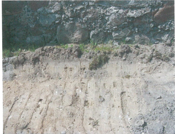
50. 2-oji šaligatvio atkarpa iš R pusės (228-230 m)