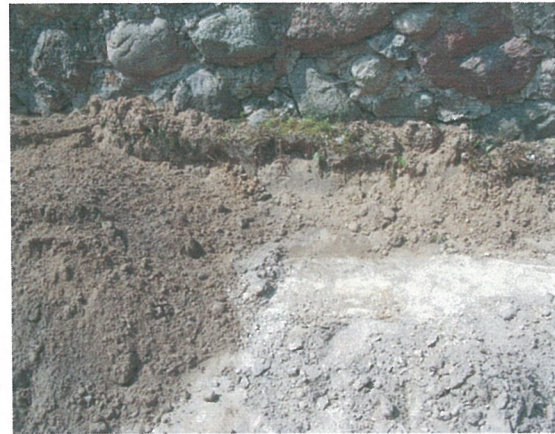
40. 2-oji šaligatvio atkarpa iš R pusės (198-200 m)