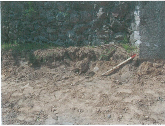
37. 2-oji šaligatvio atkarpa iš R pusės (189-191 m)