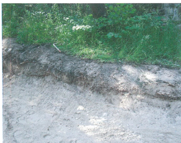
15. 2-oji šaligatvio atkarpa iš R pusės (123-125 m)