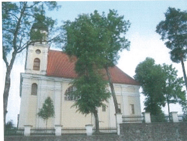
4. Trinapolio bažnyčia iš ŠV pusės, 2007 m.