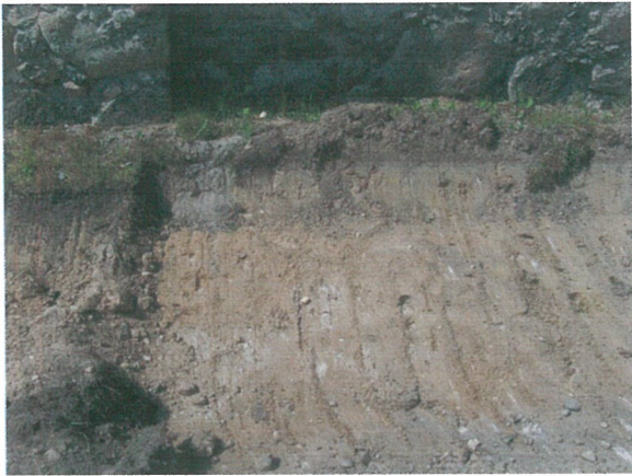
49. 2-oji šaligatvio atkarpa iš R pusės (225-227 m)