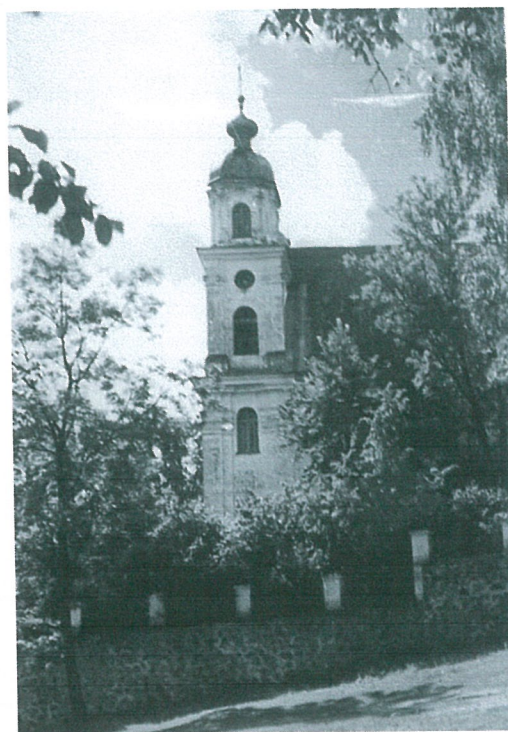
2. Trinapolio bažnyčios šoninis fasadas. 1951 m. (VAA, F. 5, b. 6560)