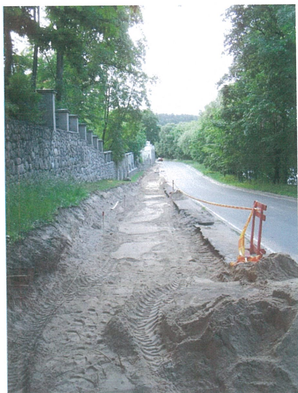
11. 2-oji šaligatvio atkarpa iš P pusės