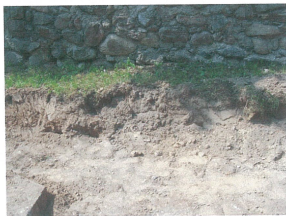
36. 2-oji šaligatvio atkarpa iš R pusės (186-188 m)