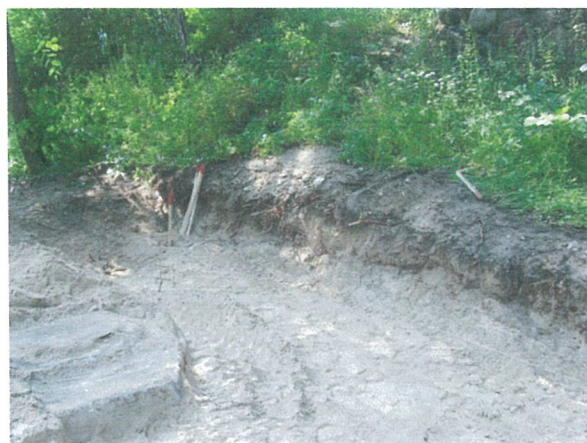
14. 2-oji šaligatvio atkarpa iš R pusės (120-122 m)