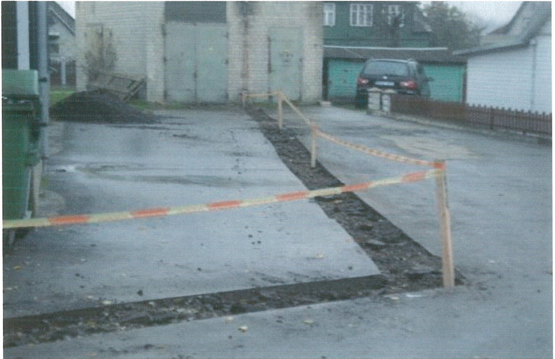
Nuotrauka Nr. 2. Sklypo pietrytinė dalis.