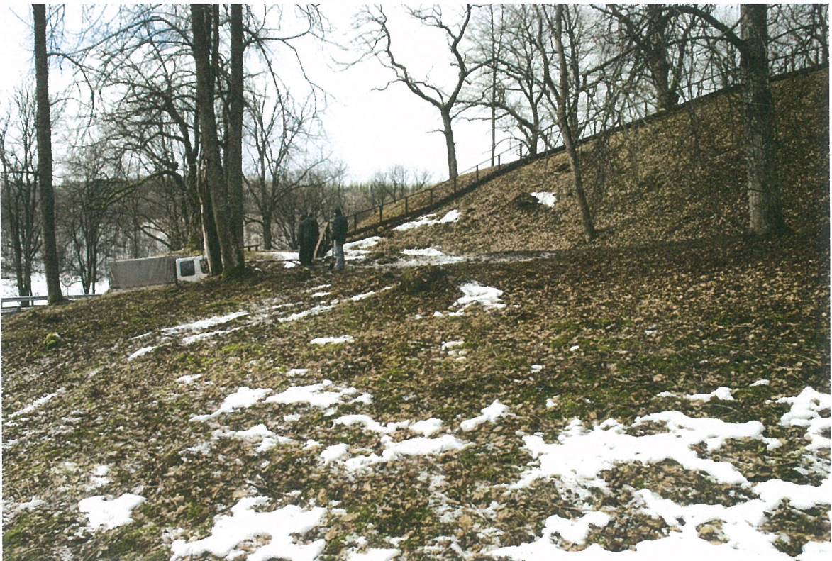
Pav. 4 Teritorija prieš trasos kasimą, vaizdas iš R pusės.