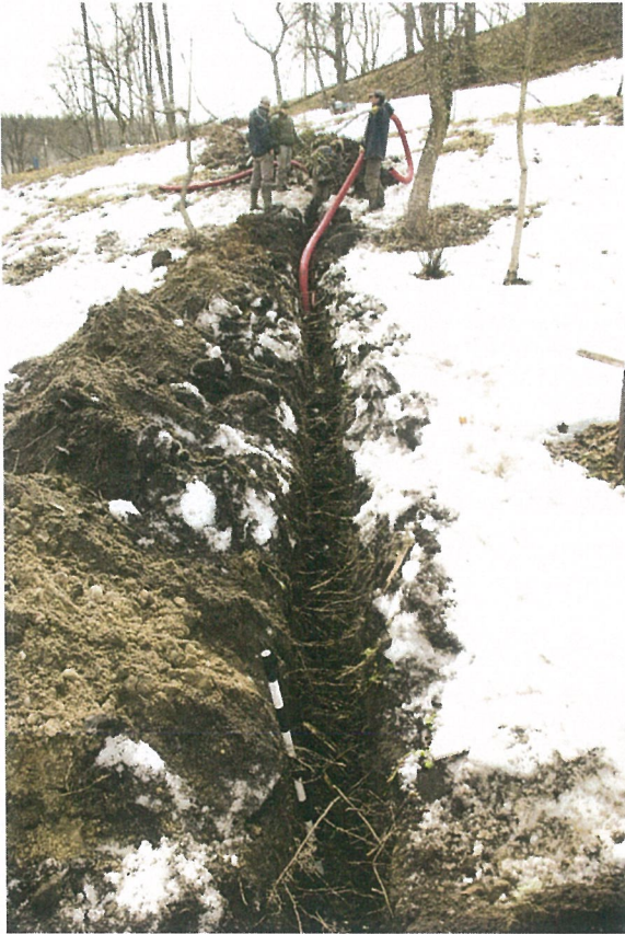
Pav. 9 Trasa el. kabeliui ties 60 jos m, vaizdas iš R pusės.