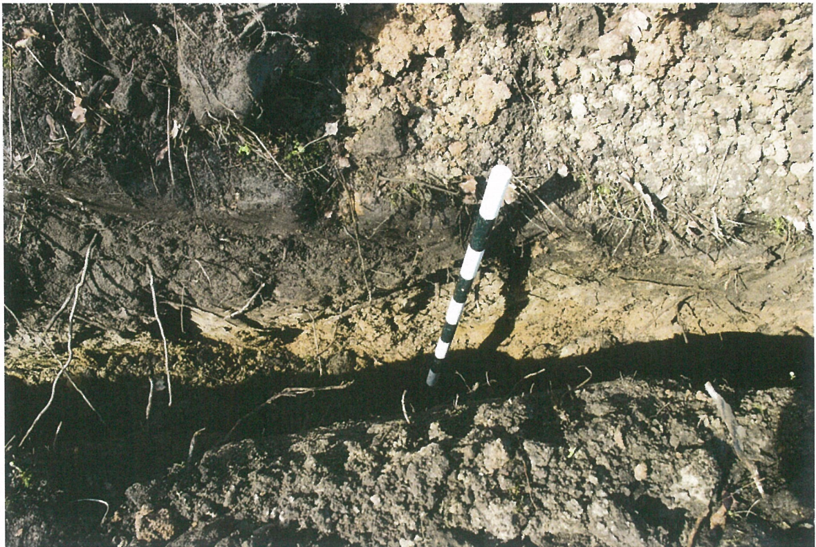
Pav. 8 Ties 20-30 trasos metru fiksuotas labai plonas juodos žemės sluoksnis, vaizdas iš P pusės.