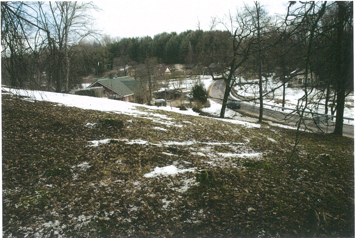
Pav. 3 Teritorija prieš trasos kasimą, vaizdas iš V pusės.