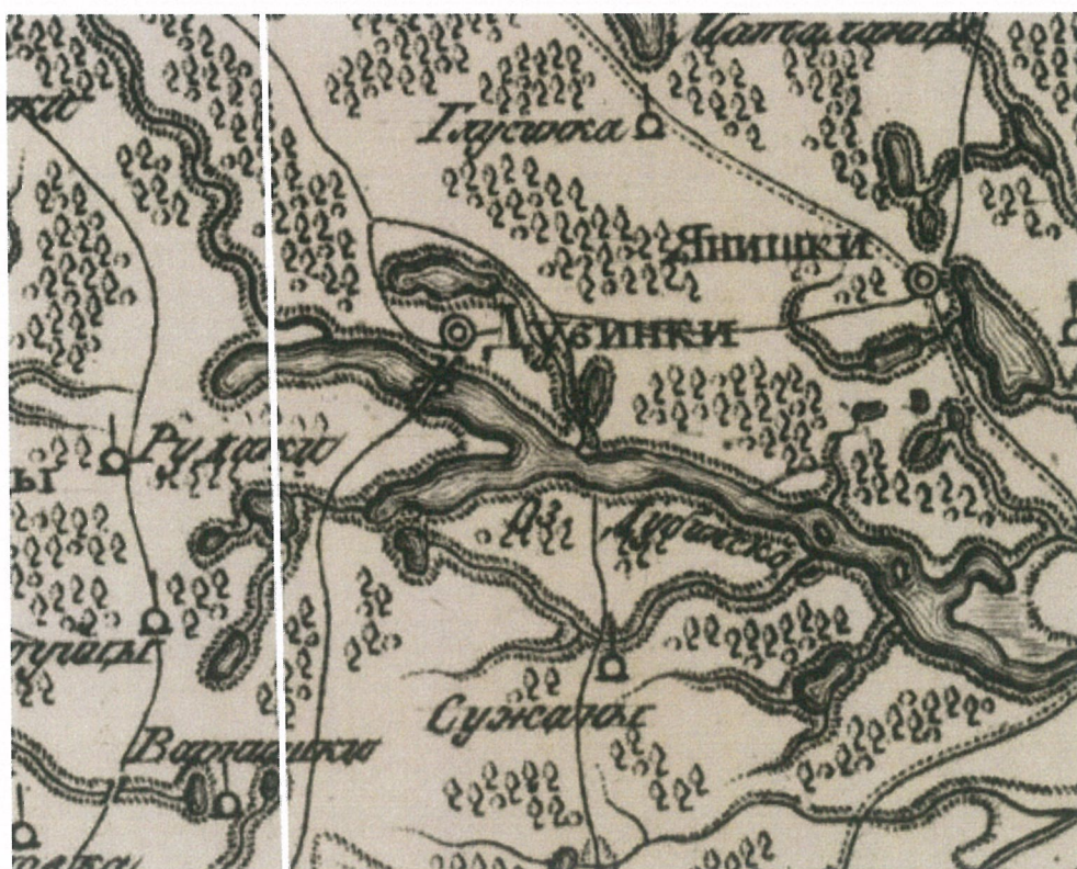
Pav. 2 1799 m. planas, Dubingių piliavietė su krantu jungia du tiltai.