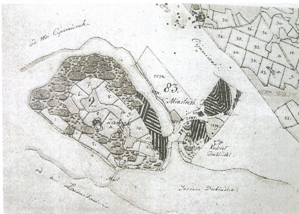
Pav. 1 1851 m. Dubingių piliavietės planas, piliavietė su miesteliu jau sujungta ne tiltu.