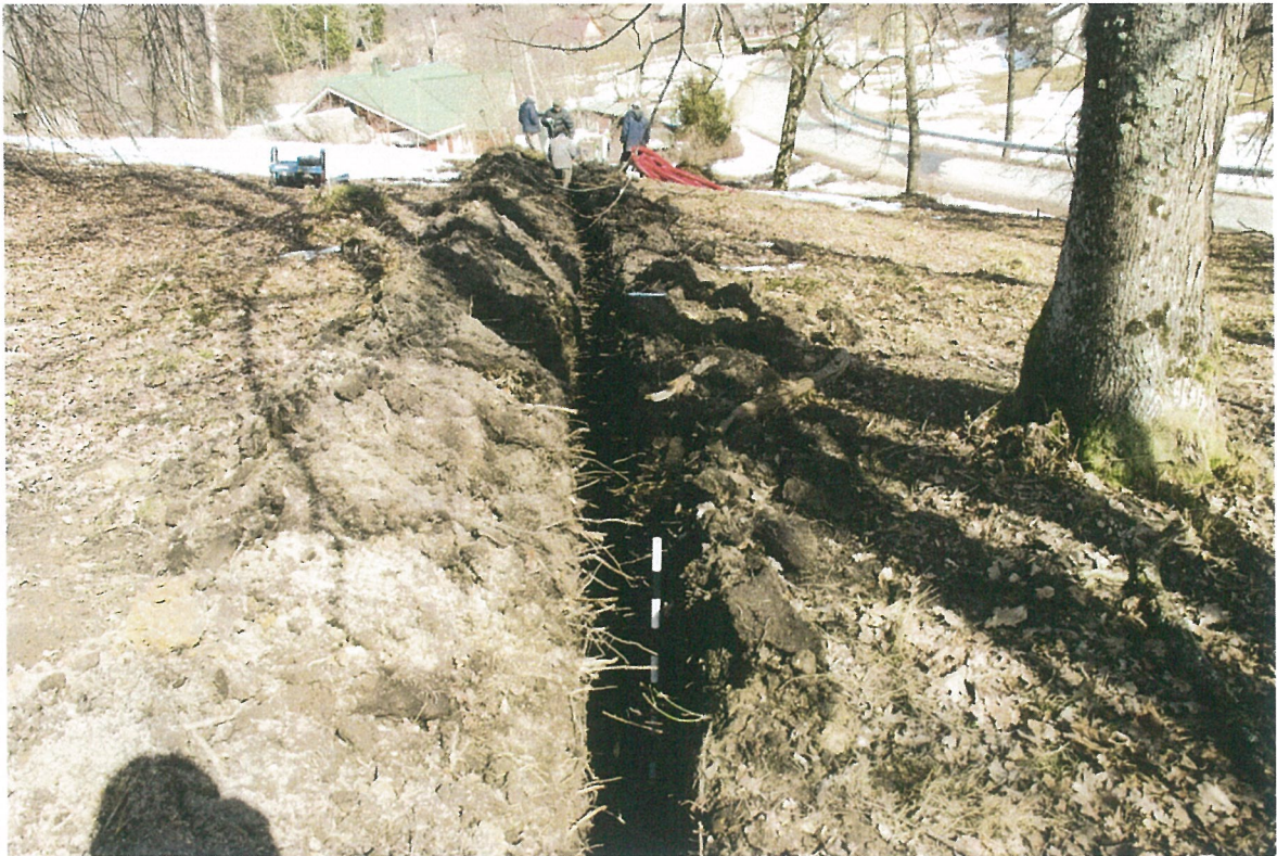
Pav. 6 Trasa el. kabeliui, po velėna juodos žemės sluoksnis itin gausiai peraugęs šaknimis, vaizdas iš V pusės.