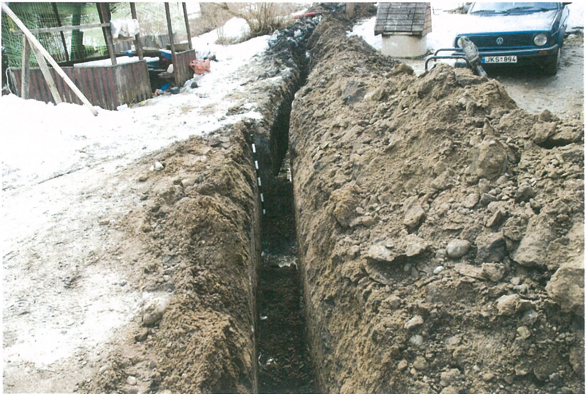
Pav. 10 El. kabelio trasa Radvilų g. 7 kieme, vaizdas iš R pusės.