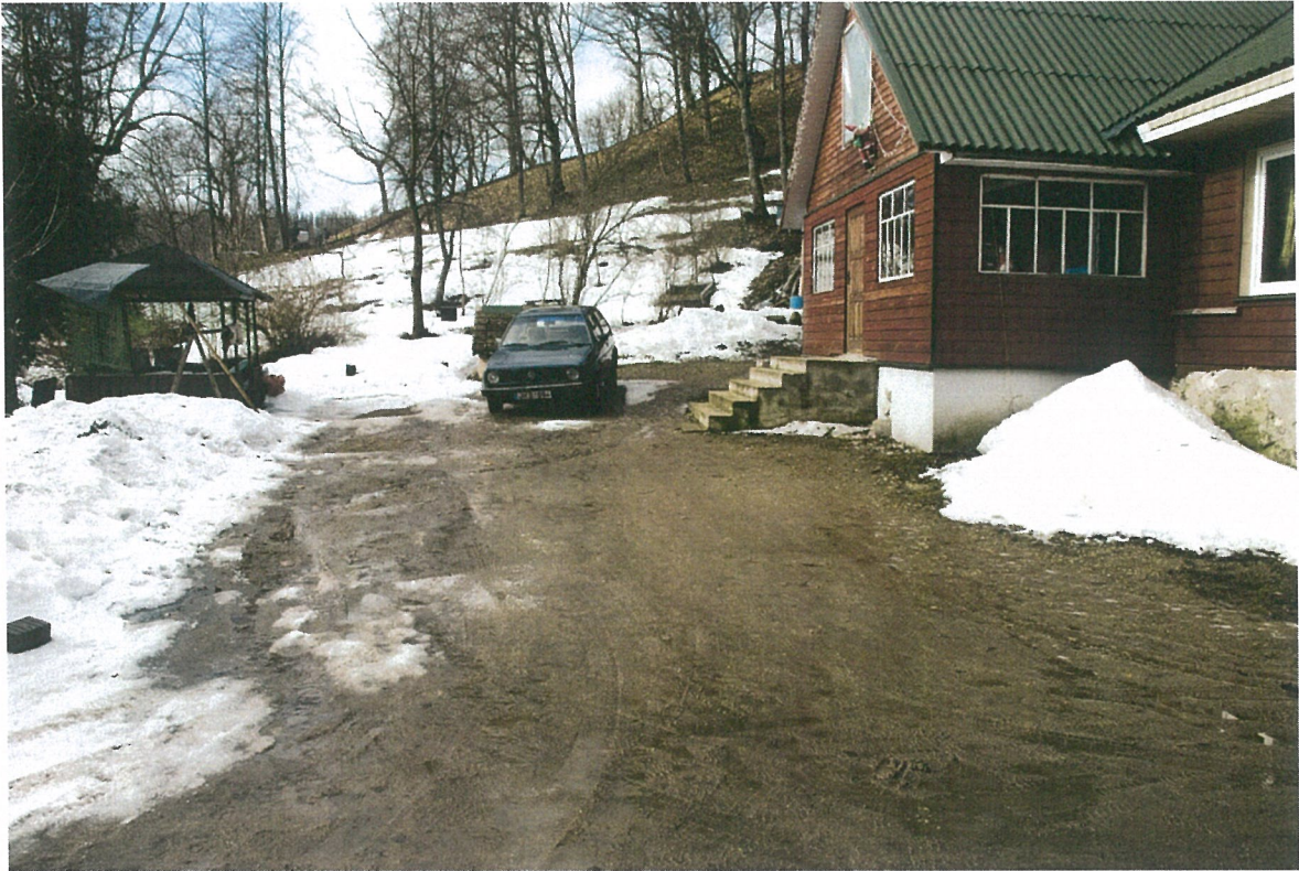
Pav. 5 Teritorija prieš trasos kasimą, vaizdas iš R pusės.