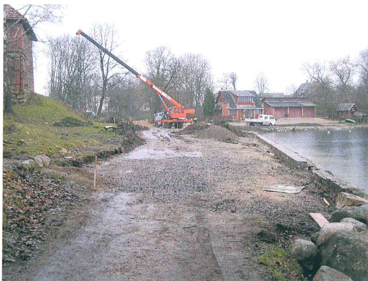
3 pav. Statybos darbų vieta prieš pradėdant žvalgymus