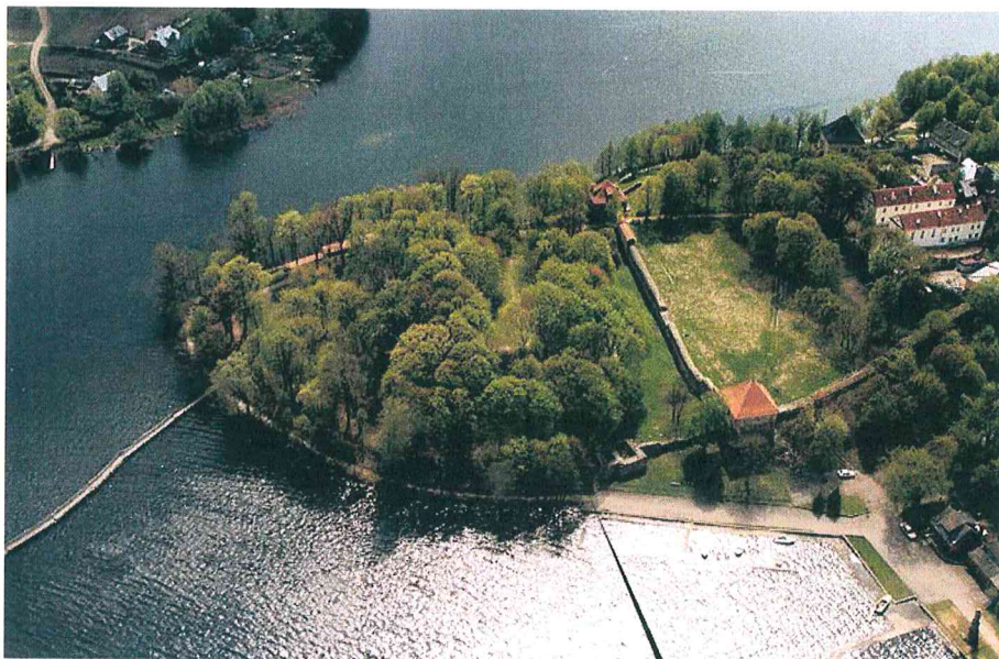
rekonstruojama tako atkarpa prieš statybos darbus