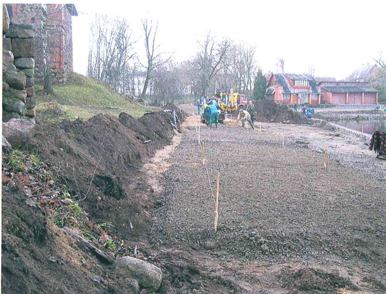
6 pav. Archeologinių žvalgymų pabaiga – pilami smėlio ir skaldos sluoksniai