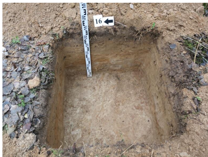
66. Šurfo nr. 16 V pjūvis