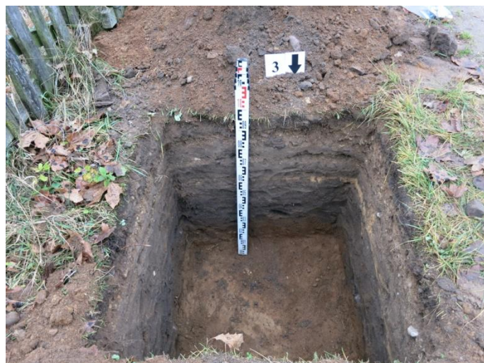
14. Šurfo nr. 3 P pjūvis