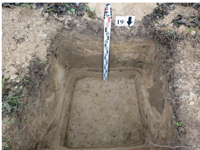
77. Šurfo nr. 19 P pjūvis