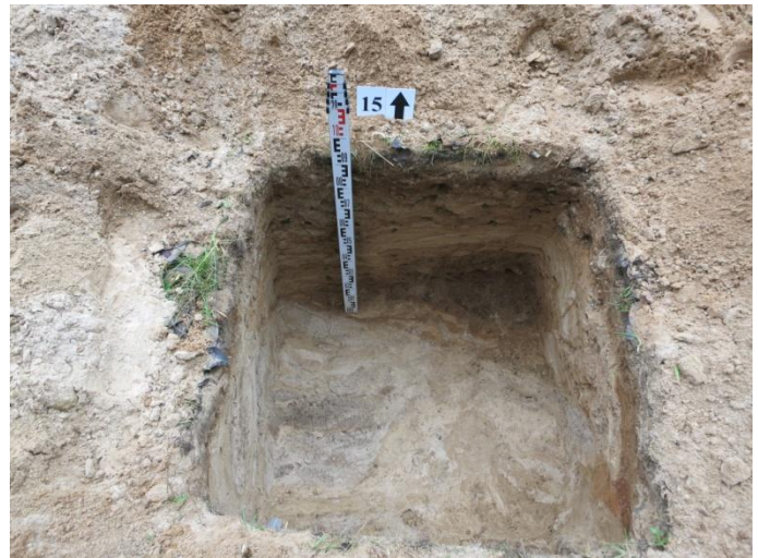
60. Šurfo nr. 15 Š pjūvis