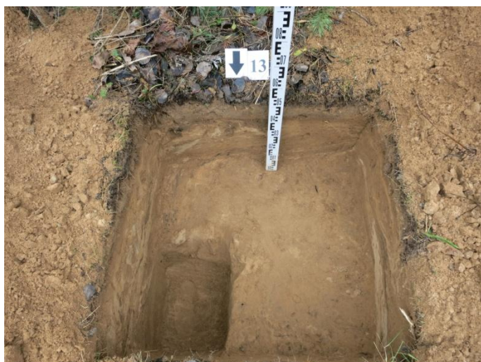
53. Šurfo nr. 13 P pjūvis.