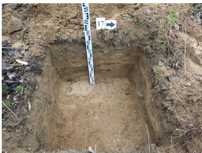
71. Šurfo nr. 17 R pjūvis