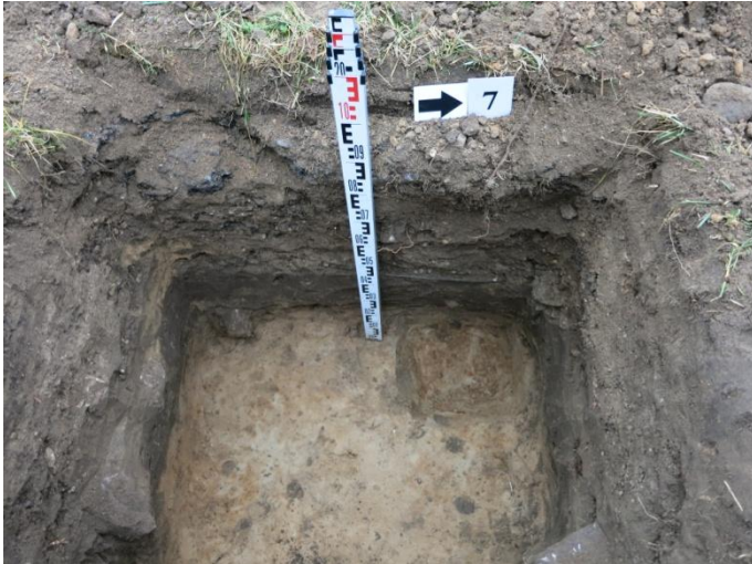
31. Šurfo nr.7 R pjūvis