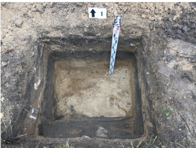
5. Šūrfas nr. 1, Š pjūvis.