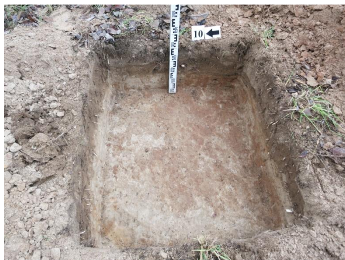
42. Šurfo nr. 10 V pjūvis