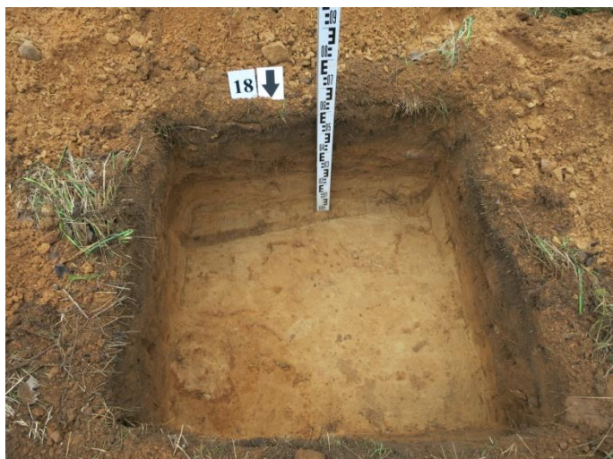
73. Šurfo nr. 18 P pjūvis