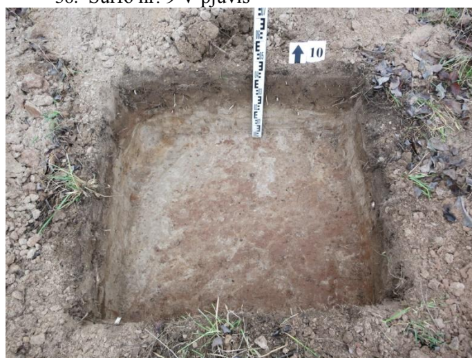
40. Šurfo nr. 10 S pjūvis