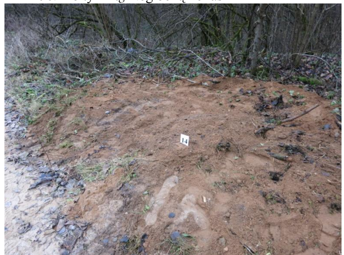
100. Po tyrimų, Negibėnų kelias