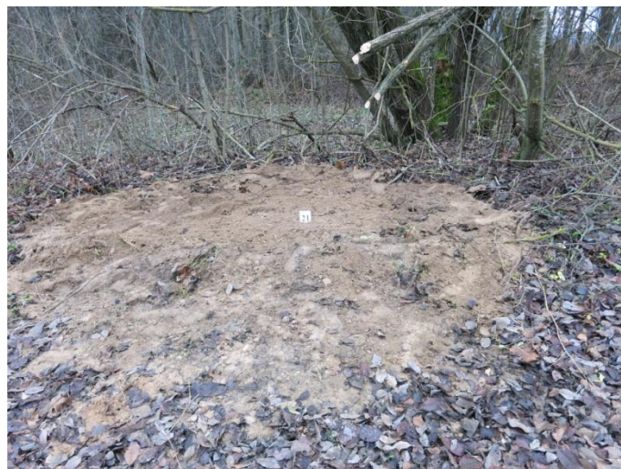
107. Po tyrimų, palei Negibėnų kelią