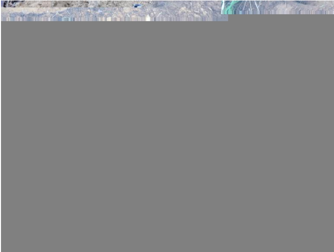
85. Šurfo nr. 21 P pjūvis