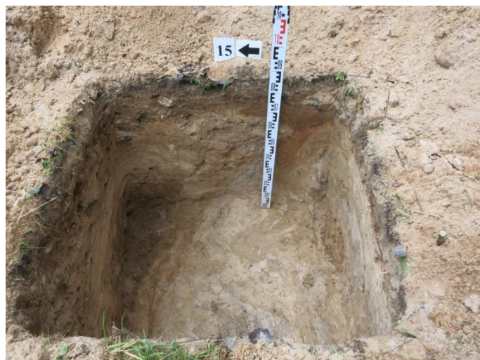
62. Šurfo nr. 15 V pjūvis