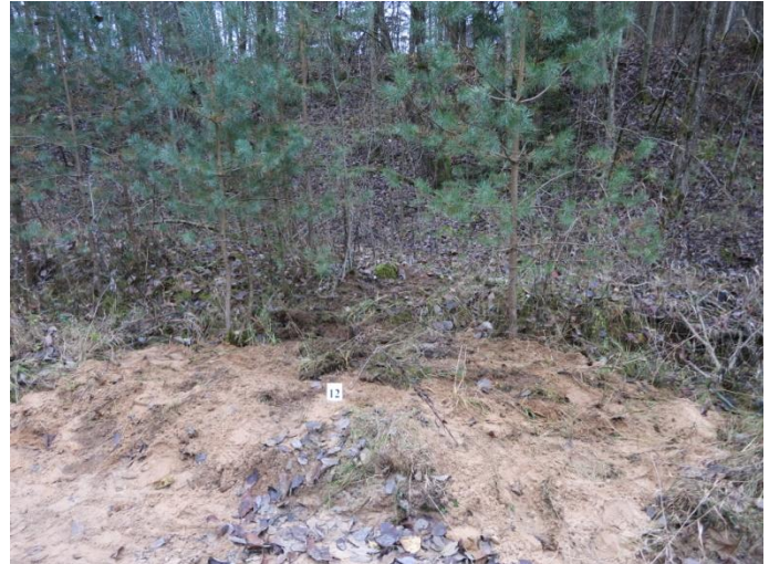
98. Po tyrimų, Negibėnų kelias