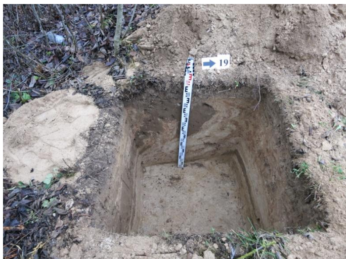
79. Šurfo nr. 19 R pjūvis