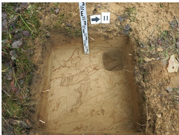
47. Šurfo nr. 11 R pjūvis