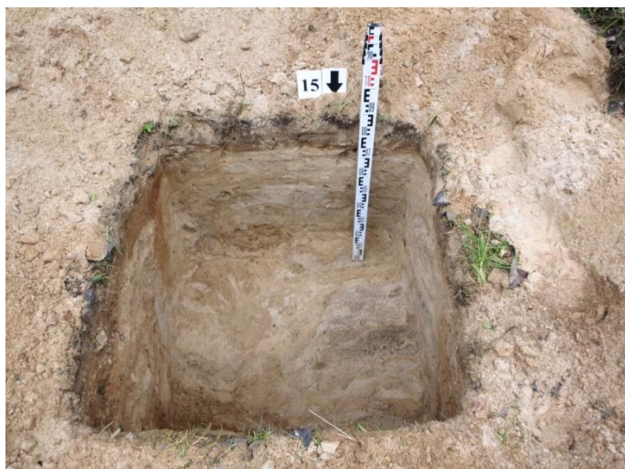
61. Šurfo nr. 15 P pjūvis