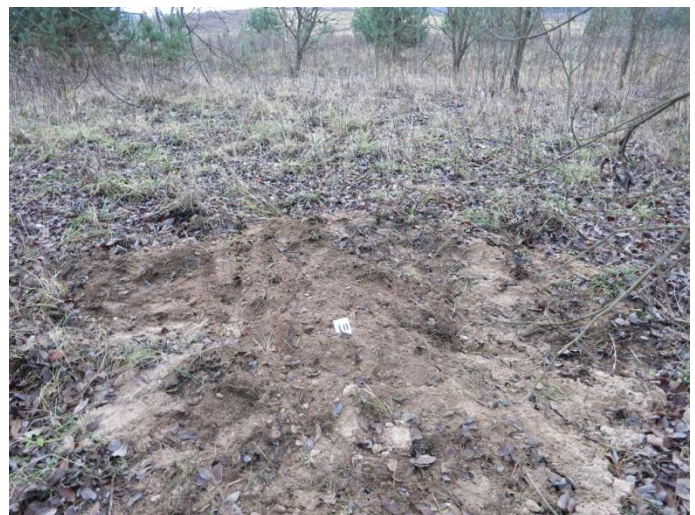
96. Po tyrimų, Negibėnų kelias