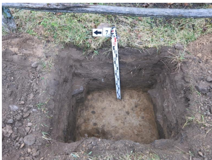
30. Šurfo nr. 7 V pjūvis