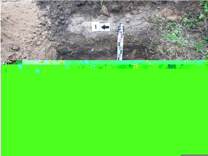
7. Šurfo nr. 1 V pjūvis