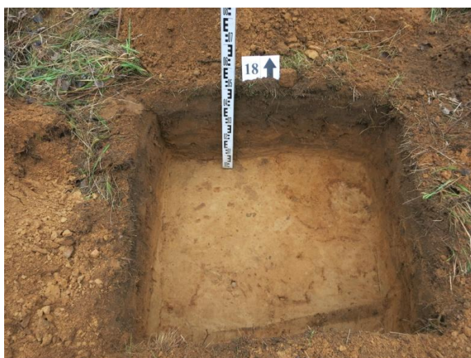
72. Šurfas nr. 18 R pjūvis.