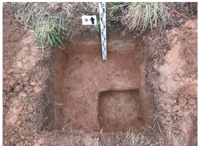
36. Šurfo nr. 9 Š pjūvis