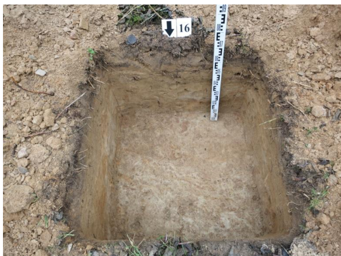
65. Šurfo nr. 16 P pjūvis