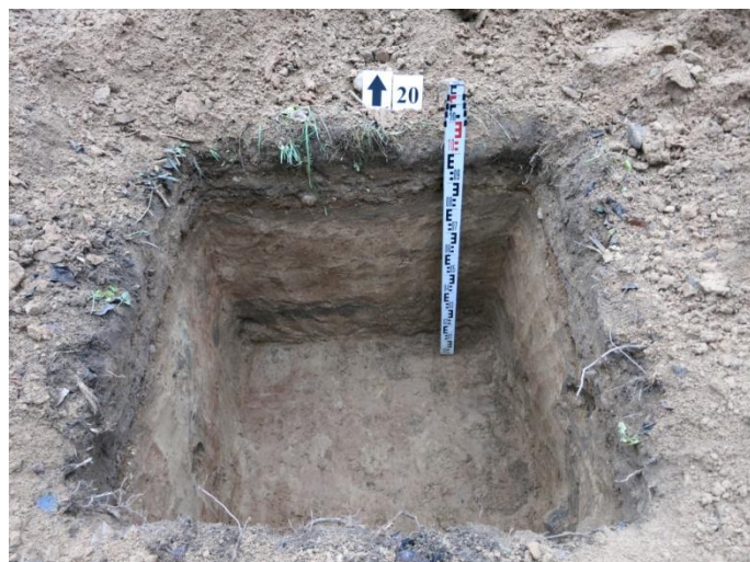
80. Šurfo nr. 20 Š pjūvis