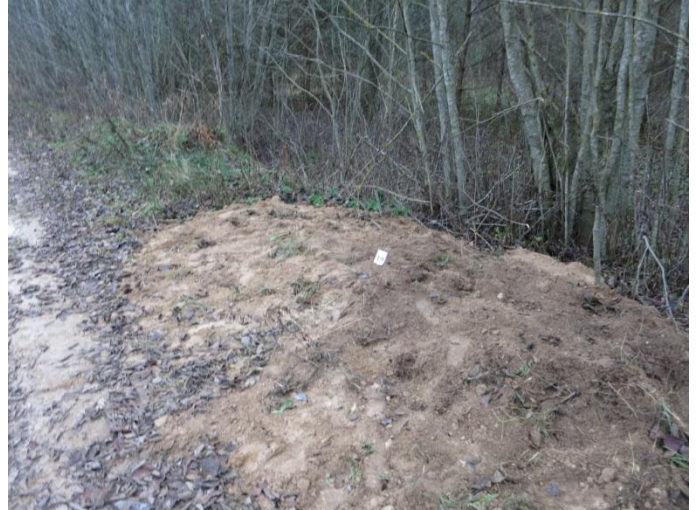
104. Po tyrimų Negibėnų kelias