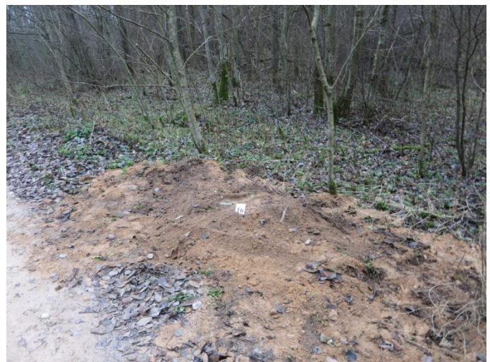
102. Po tyrimų Negibėnų kelias