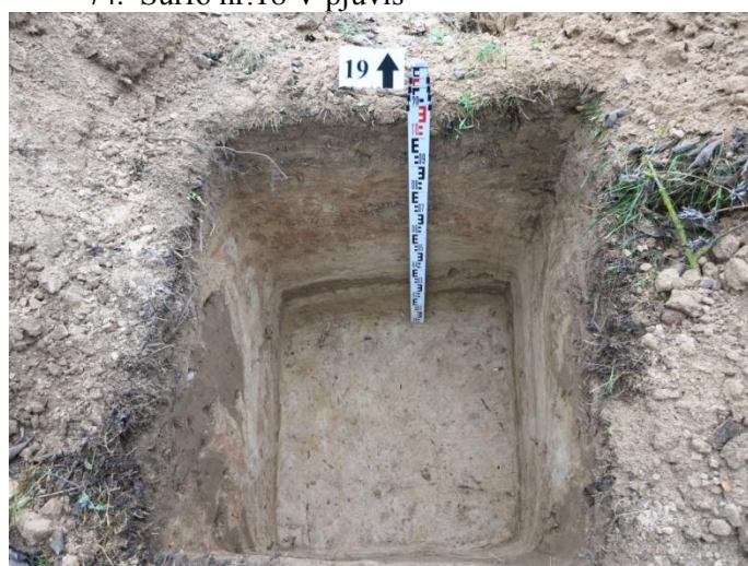
76. Šurfo nr. 19 Š pjūvis