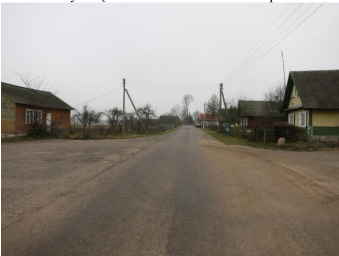
3. Tyrimų vietos bendras vaizdas iš R pusės.