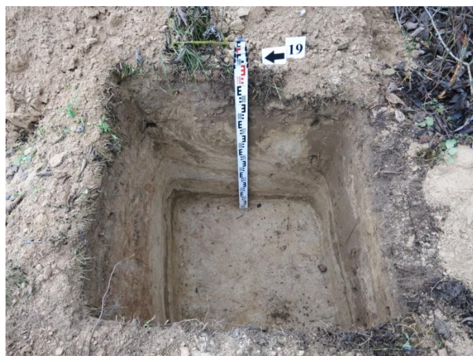
78. Šurfo nr.19 V pjūvis