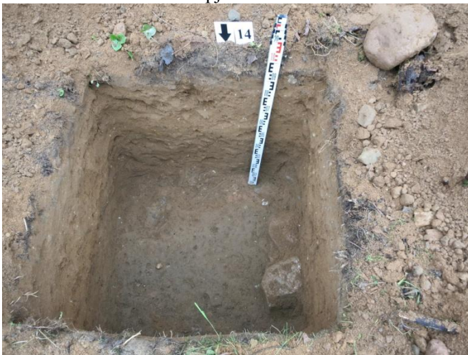
57. Šurfo nr. 14 P pjūvis