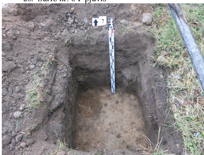
28. Šurfo nr. 7 Š pjūvis