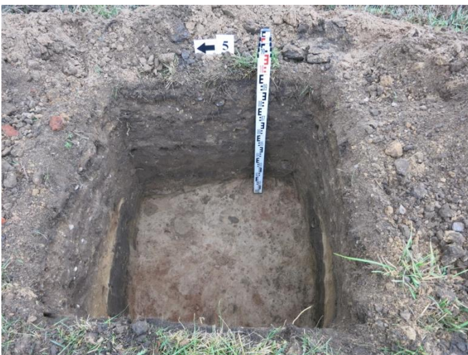
23. Šurfo nr. V pjūvis.