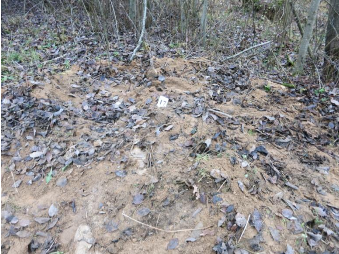
103. Po tyrimų, Negibėnų kelias