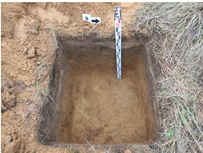
35. Šurfo nr. 8 Š R pjūvis