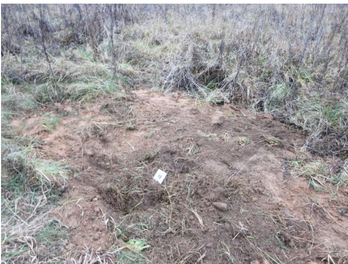
95. Po tyrimų, Negibėnų kelias