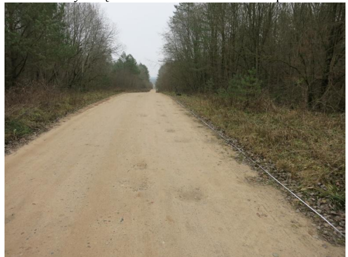
4. Tyrimų vietos bendras vaizdas iš ŠV pusės.