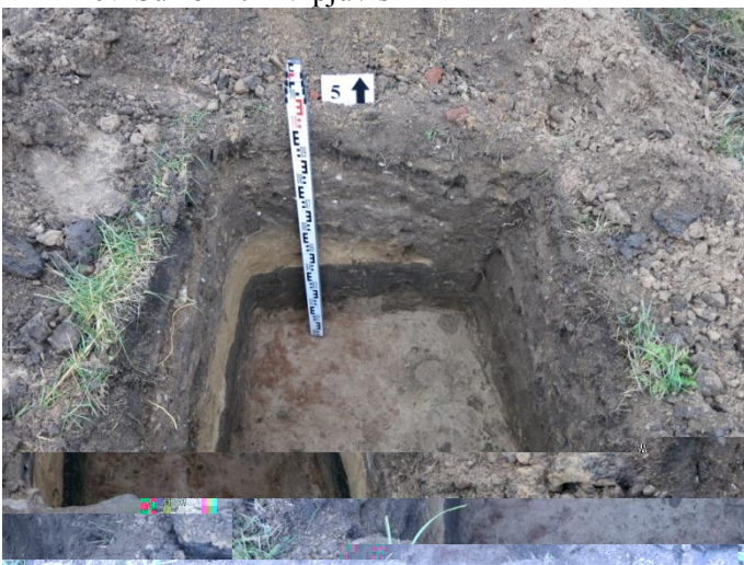
21. Šurfo nr. 5 Š pjūvis