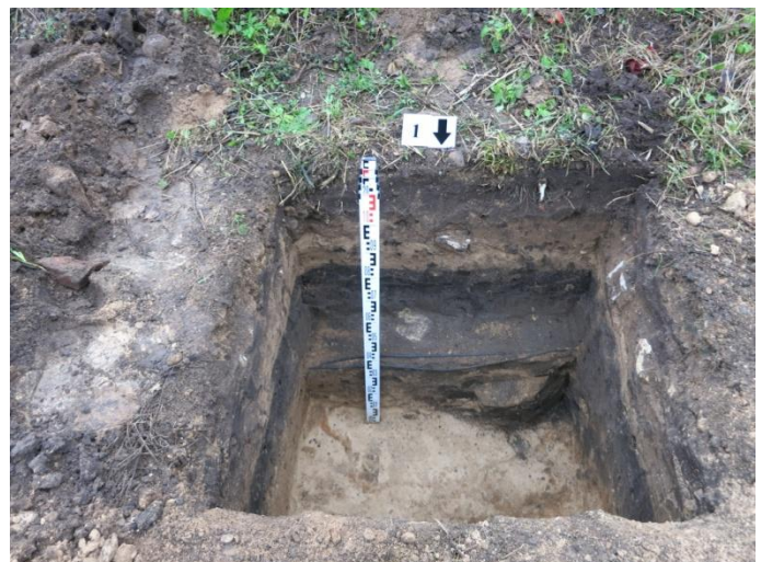
6. Šūrfas nr. 1 P pjūvis.