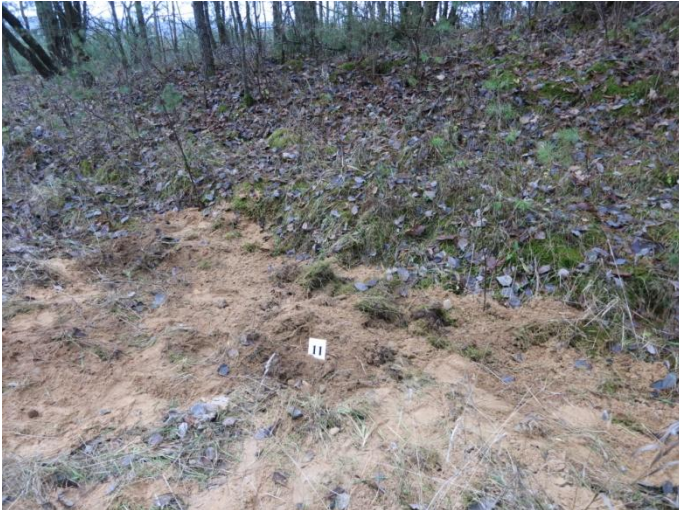
97. Po tyrimų, Negibėnų kelias