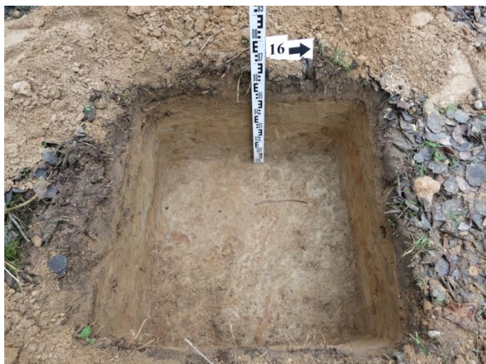
67. Šurfo nr. 16 R pjūvis