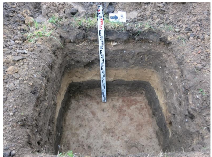
24. Šurfo nr. 5 R pjūvis.