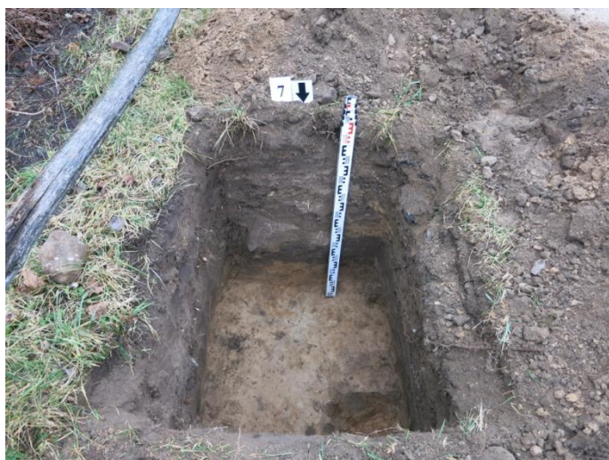
29. Šurfo nr. 7 P pjūvis