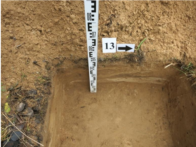
55. Šurfo nr. 13 R pjūvis