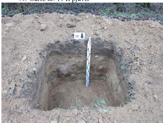
81. Šurfo nr. 20 P pjūvis