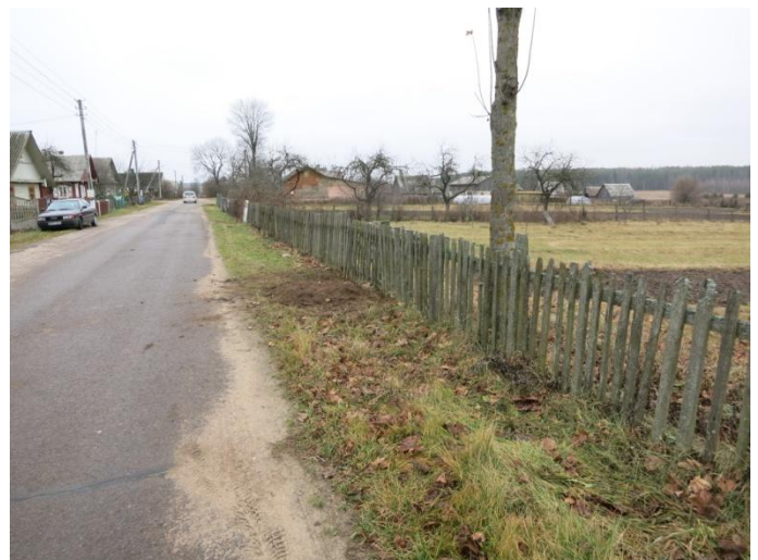
90. Po tyrimų, Karmelionių g.