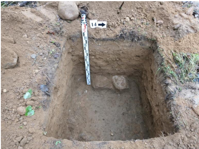
59. Šurfo nr. 14 R pjūvis