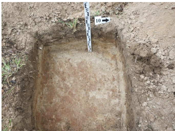
43. Šurfo nr. R pjūvis