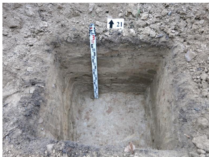
84. Šurfo nr. 21 Š pjūvis