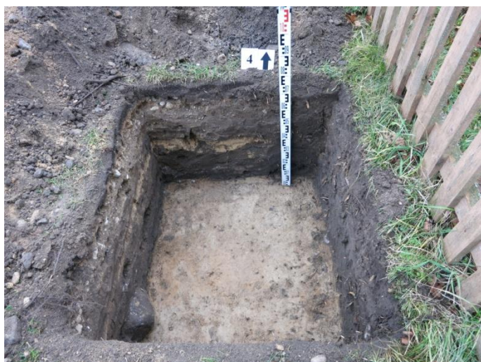
17. Šurfo nr. 4 Š pjūvis