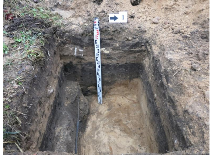
8. Šurfo nr. 1 R pjūvis