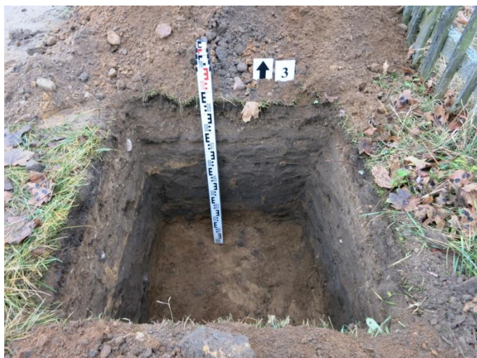
13. Šurfo nr. 3 Š pjūvis