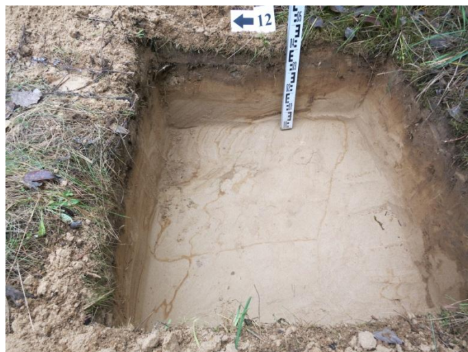
50. Šurfo nr. 12 V pjūvis