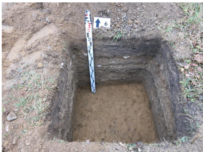
25. Šurfo nr. 6 Š pjūvis