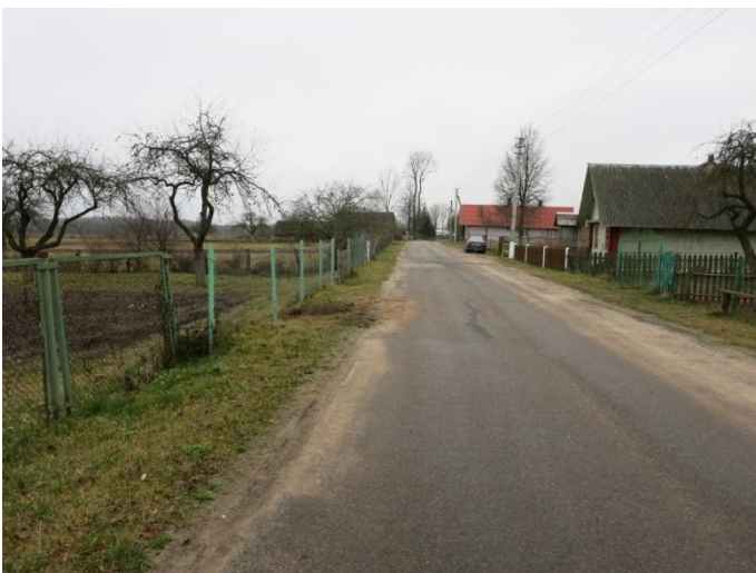
89. Po tyrimų, šurfo nr. 7 vieta