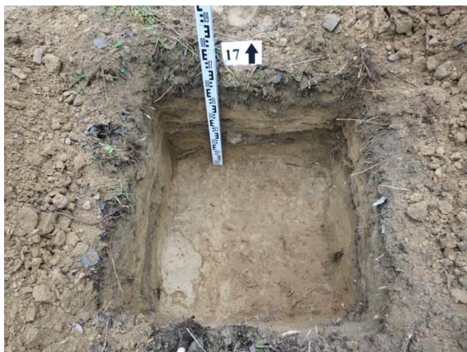
68. Šurfo nr. 17 Š pjūvis