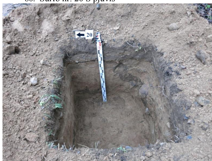
82. Šurfo nr. 20 V pjūvis