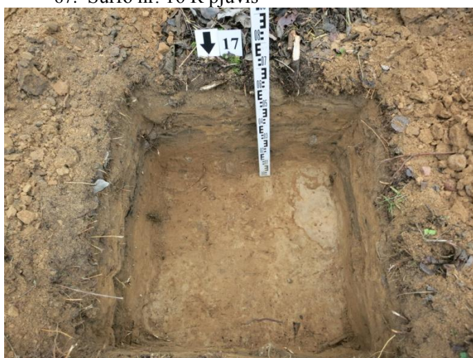
69. Šurfo nr. 17 P pjūvis