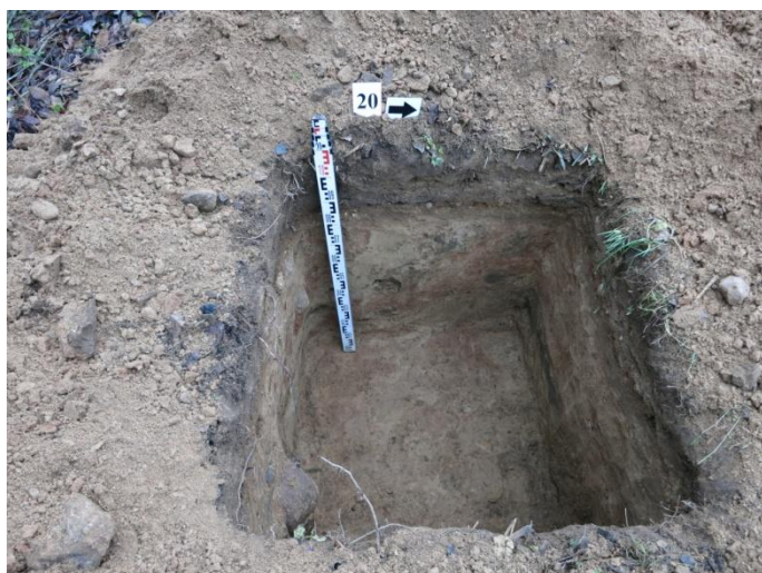
83. Šurfo nr. 20 R pjūvis