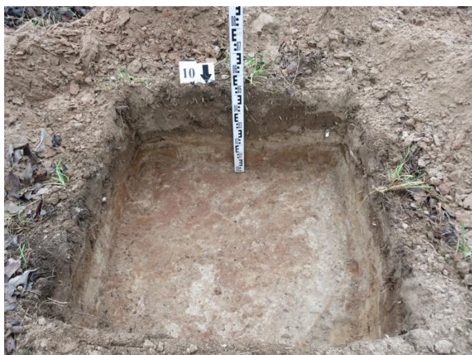
41. Šurfo nr. 10 P pjūvis