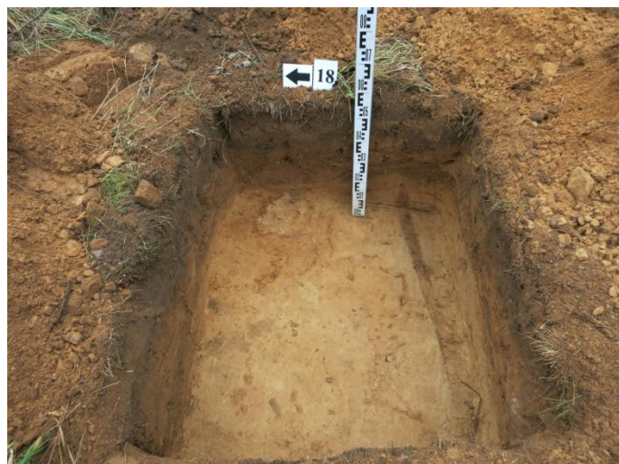
74. Šurfo nr.18 V pjūvis