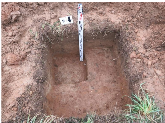
37. Šurfo nr. 9 P pjūvis