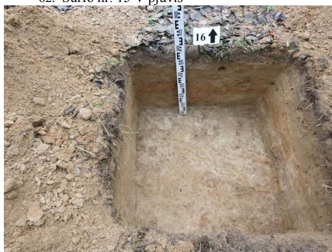
64. Šurfo nr. 16 S pjūvis