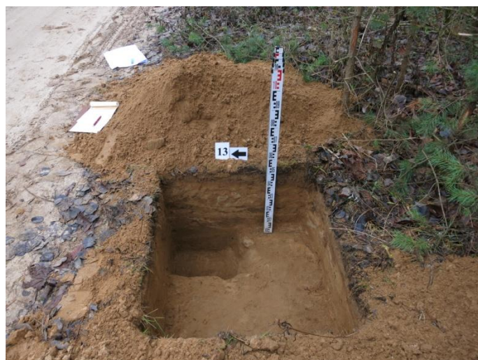
54. Šurfo nr. 13 V pjūvis