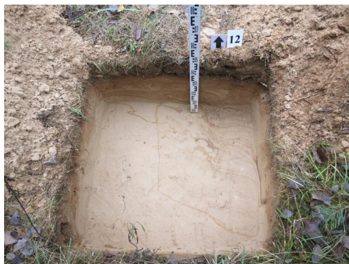
48. Šurfo nr. 12 Š pjūvis