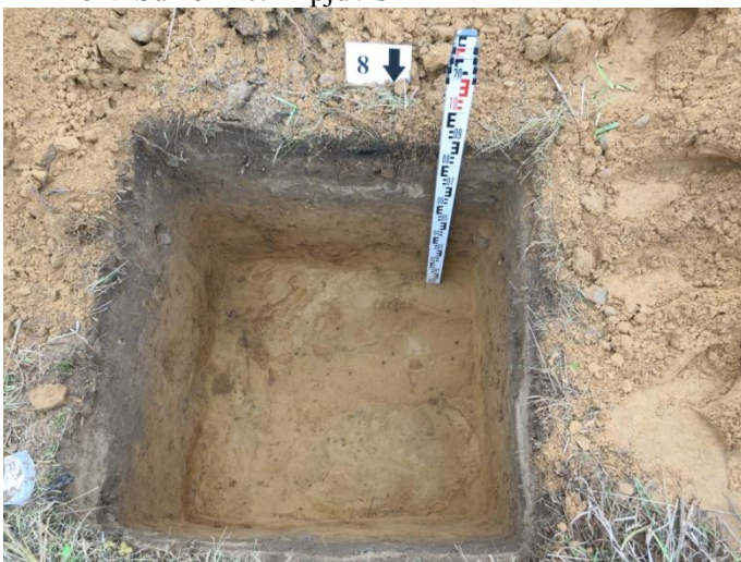
33. Šurfo nr. 8 P pjūvis