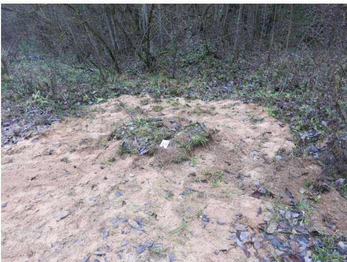
101. Po tyrimų, Negibėnų kelias