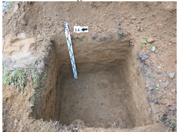
58. Šurfo nr. 14 V pjūvis