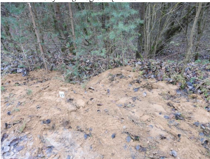
99. Po tyrimų, Negibėnų kelias