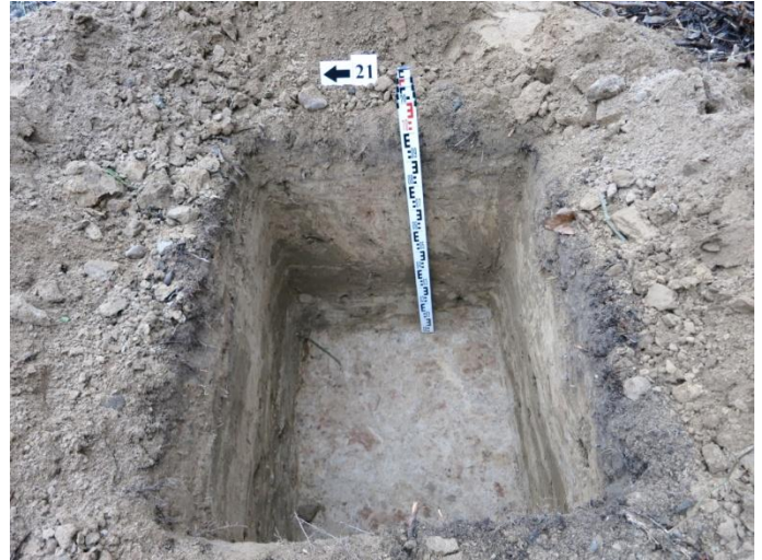
86. Šurfo nr. 21 V pjūvis