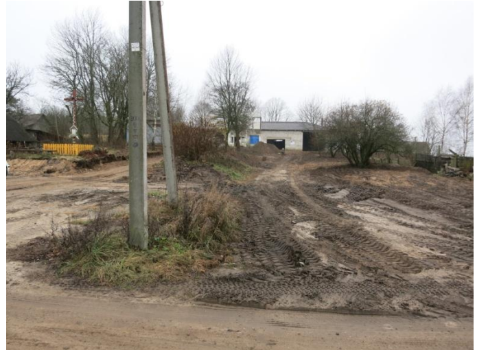
2. Tyrimų vietos bendras vaizdas iš V pusės.