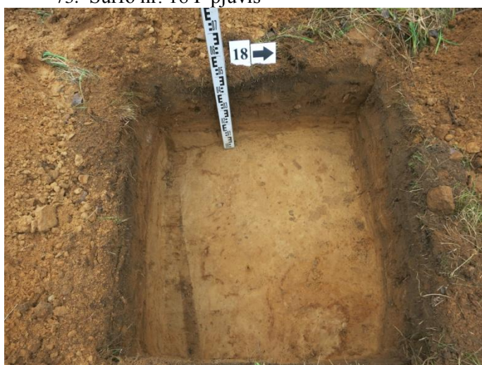
75. Šurfo nr. 18 R pjūvis