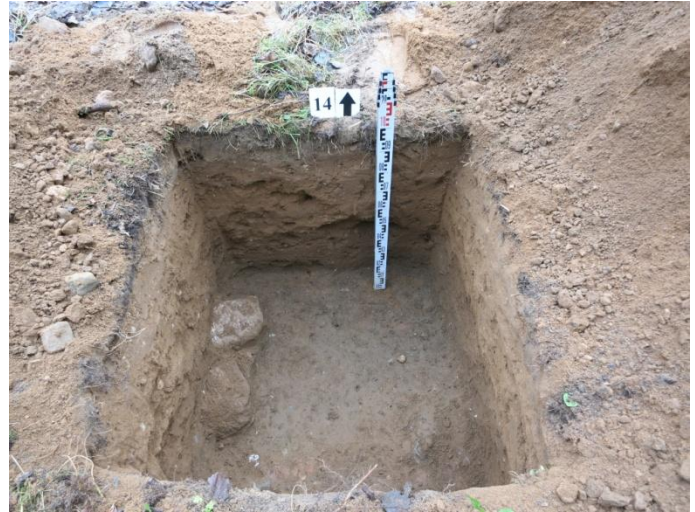
56. Šurfo nr. 14 Š pjūvis