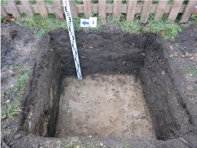
19. Šurfo nr. 4 V pjūvis