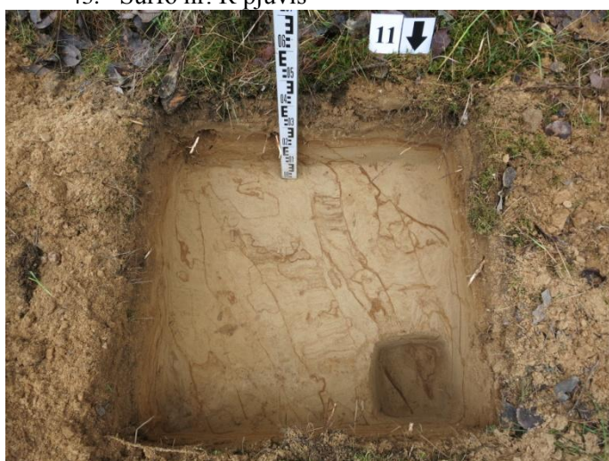
45. Šurfo nr. 11 P pjūvis