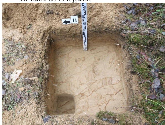
46. Šurfo nr. V pjūvis