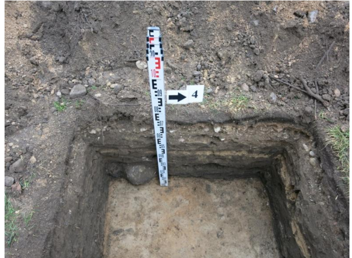
20. Šurfo nr. 4 R pjūvis