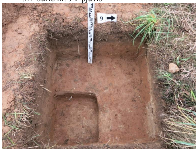
39. Šurfo nr. 9 R pjūvis