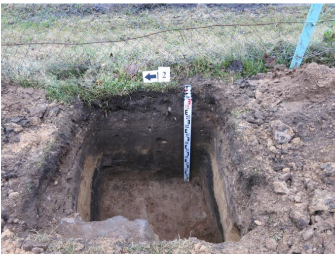
11. Šurfo nr. 2 V pjūvis