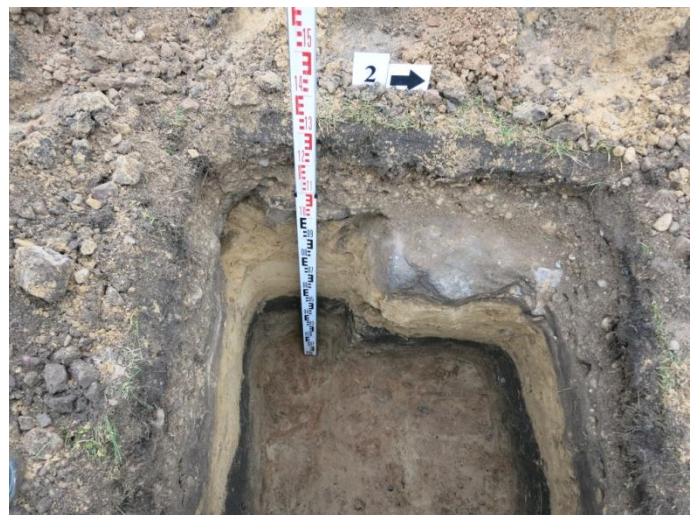
12. Šurfo nr. 2 R pjūvis.