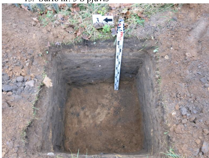
15. Šurfo nr. 3 V pjūvis