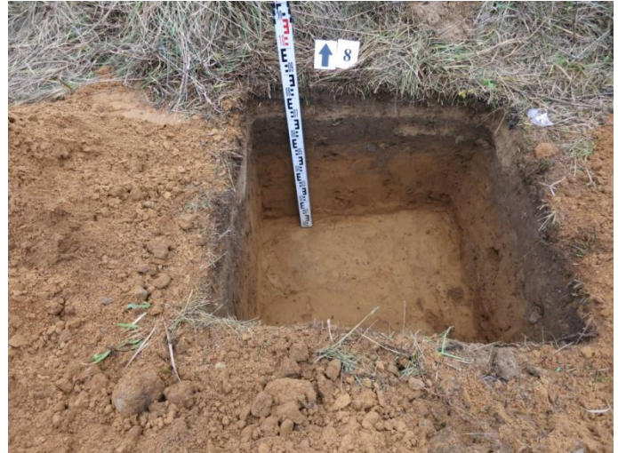
32. Šurfo nr. 8 Š pjūvis