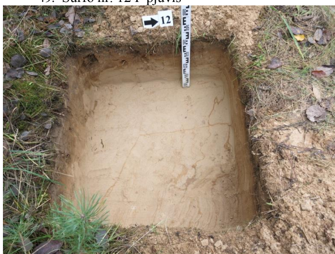
51. Šurfo nr. 12 R pjūvis