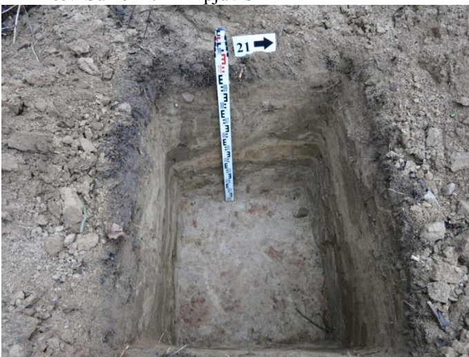
87. Šurfo nr. 21 R pjūvis