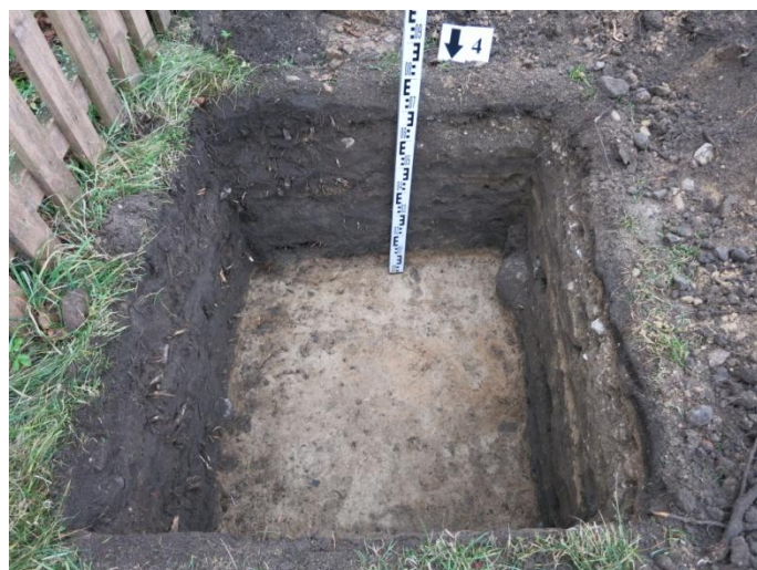
18. Šurfo nr. 4 P pjūvis