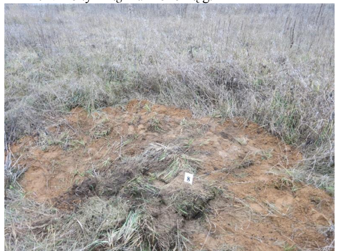
94. Po tyrimų, Negibėnų kelias