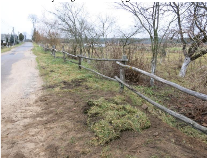
93. Po tyrimų, Kurlmelionių g.