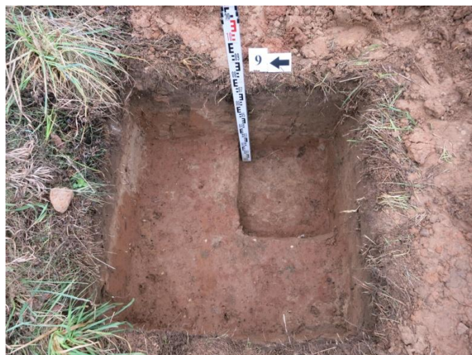
38. Šurfo nr. 9 V pjūvis