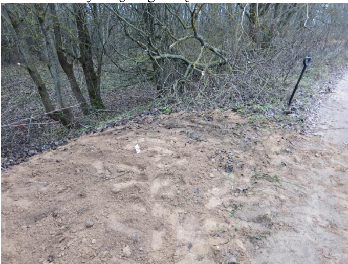
105. Po tyrimų, palei Negibėnų kelią