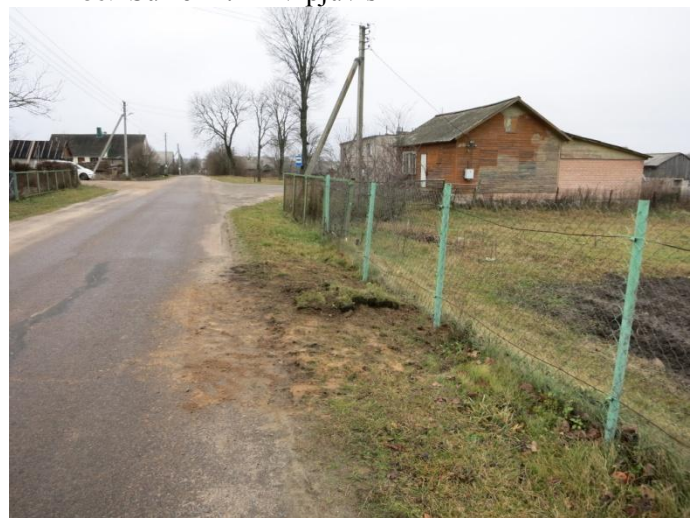
88. Po tyrimų, šurfo nr. 6 vieta