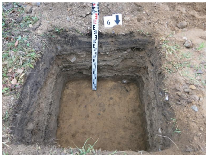
26. Šurfo nr. 6 P pjūvis