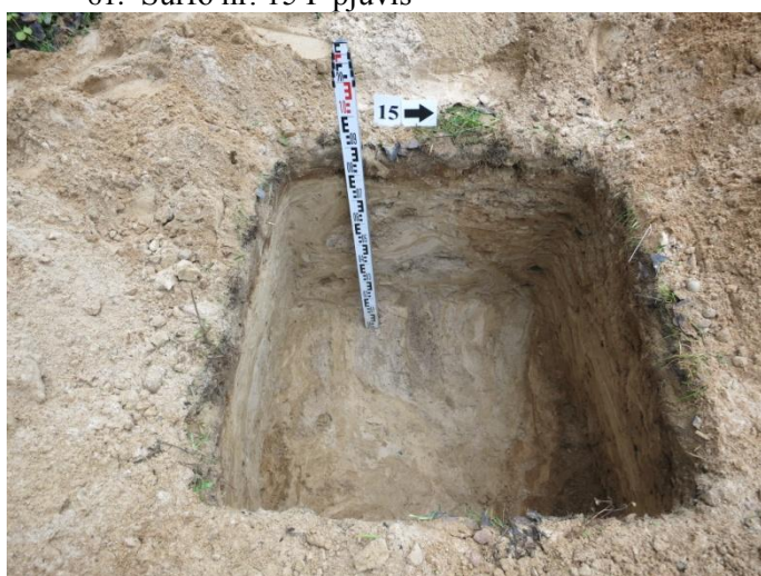
63. Šurfo nr. 15 R pjūvis