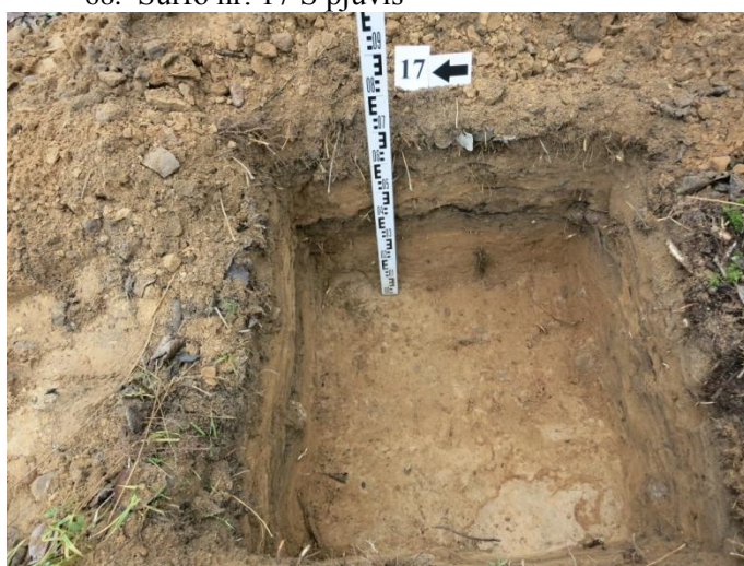
70. Šurfo nr. 17 V pjūvis