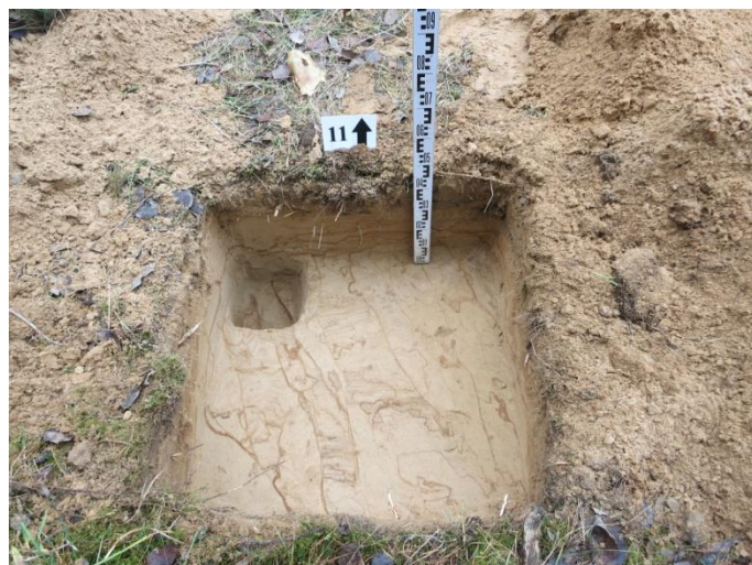
44. Šurfo nr. 11 Š pjūvis