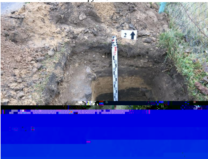
9. Šurfo nr. 2 Š pjūvis