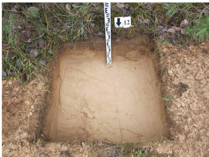
49. Šurfo nr. 12 P pjūvis