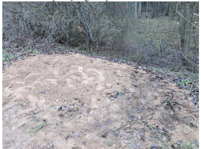
106. Po tyrimų, palei Negibėnų kelią