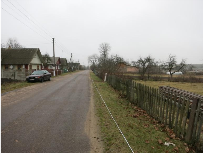
1. Tyrimų vietos bendras vaizdas iš P pusės.