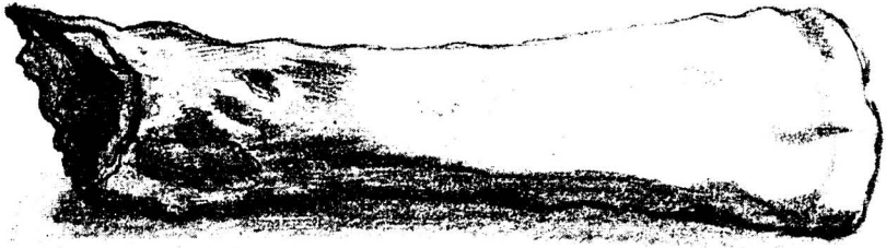
Fig. 1. Celt żelazny z grobu szkieletowego w Rajniach pod Telszami.

1. Celt żelazny, obacz fig. 1. Długość jego wynosi 0·23 metra; średnica przy osadzie 0·042 m. i szerokość ostrza 0·060 m. Analogiczny z nim znaleziony został przez Tad. Dowgirda na cmentarzysku Mełżyn-Kapas na folw. Wizdergi w powiecie szawelskim w r. 1884., lecz o wiele od niego mniejszy 1) .