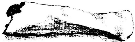
Fig. 2. Celt żelazny mniejszy z grobu szkieletowego w Rajniach.

2. Celt żelazny, o połowę mniejszy i cokolwiek odmiennego kształtu niż poprzedni. Dług. 0·12 m.; średn. przy osadzie 0·034 m. a szerokość ostrza 0·04 m.