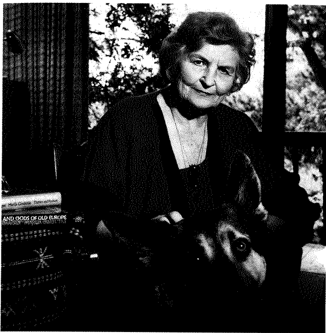
Profesorė savo darbo kambaryje su uoliu namų sargu Meškiu.

Jei rodydavo kokį dėmesio vertą filmą, niekuomet neatsisakys pasižiūrėti. Bet labiausiai mėgo klasikinius koncertus, nors ir per televiziją rodomus, o dar – operas ir baletus.