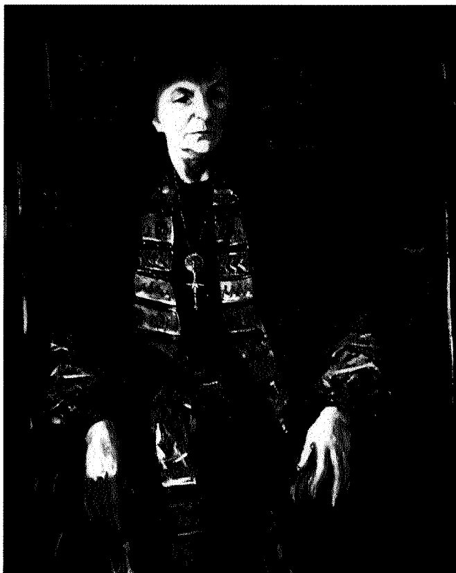
Marijos Gimbutienės portretas. Dail. Vytautas Ciplijauskas. 1981 m.