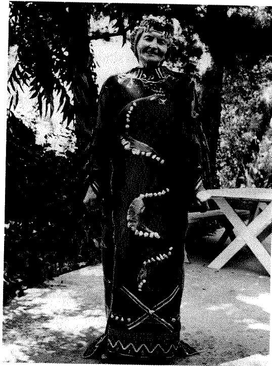
Marija pasipuošusi Eglės žalčių karalienės kostiumu. Topanga, 1993 m.