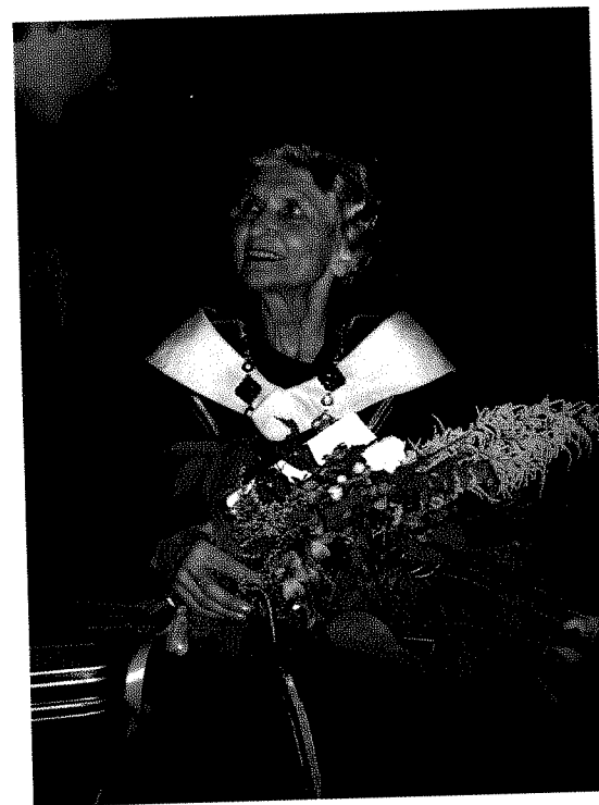
Marija Birutė Alseikaitė-Gimbutienė Vytauto Didžiojo universitete Garbės daktaro vardo suteikimo iškilmėse. VDU, 1993 m. birželis.

biologines studijas ir perskaičiau jos anglų kalba išėjusią knygą „Baltai“. Man tai buvo pritrenkiamas įspūdis, nepaprastas patyrimas, nepakartojamas atradimas.