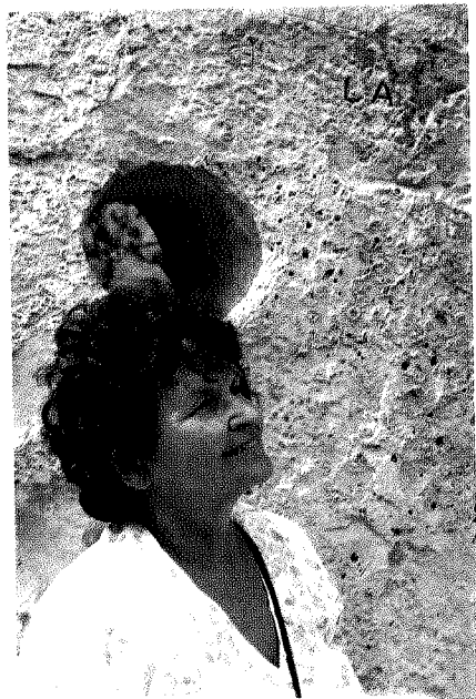
Marija Gimbutienė vienoje iš savo mokslinių kelionių, Malta, 1980 m.

da neblogai pažįsta Profesorę (Los Andželo lietuvių bendruomenėje teko susitikti). Jie kaip tik rengėsi važiuoti į Las Vegasą, į savo draugų lietuvių dukters vestuves (kartu ketino parodyti man garsųjį lošimų ir pramogų centrą), ir telefonu susitarė, kad grįždami užvažiuosime pas Profesorę į jos namus dykumoje.