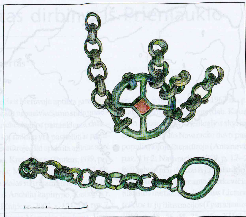
2 pav. Emaliuotas kabutis-skirstiklis

Abb. 2. Anhänger-Zwischenglied mit Email. Zeichnung von I. Maciukaiė.