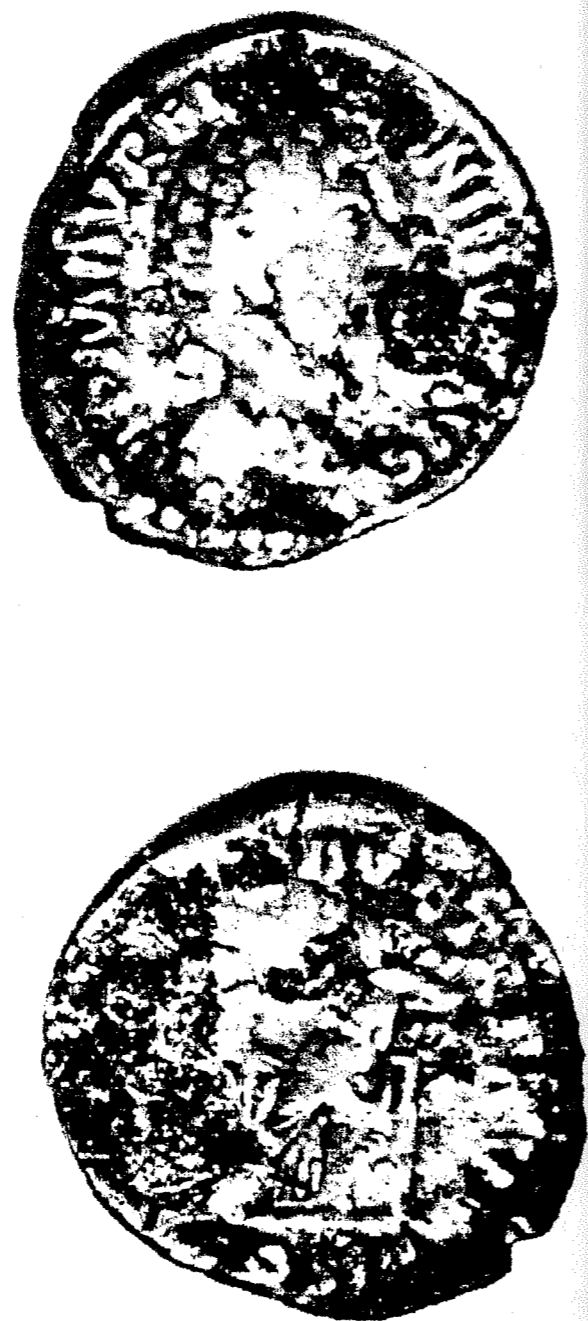
Рис. 2. Денарий Марка Аврелия. Серебро. Av.: IMP MAVREL ANT/O/NINVS/ /A/VG. Голова Марка Аврелия вправо. Rv. /CONCOR/D AVG TRP XVI. Внизу: COS III. Конкордия (Согласие) сидящая влево. Ø 18,5 mm, вес 2,8729 гр. (увеличено в 4 раза).

ной поверхностью в развале печи – каменки в заполнении типично банцеровской полуземлянки не является достаточным основанием для отнесения этого памятника к культуре штрихованной керамики. Подобные находки скорее лишь свидетельствуют о доживании реликтового разрозненного населения культуры штрихованной керамики в отдельных случаях до середины I тысячелетия н. э.