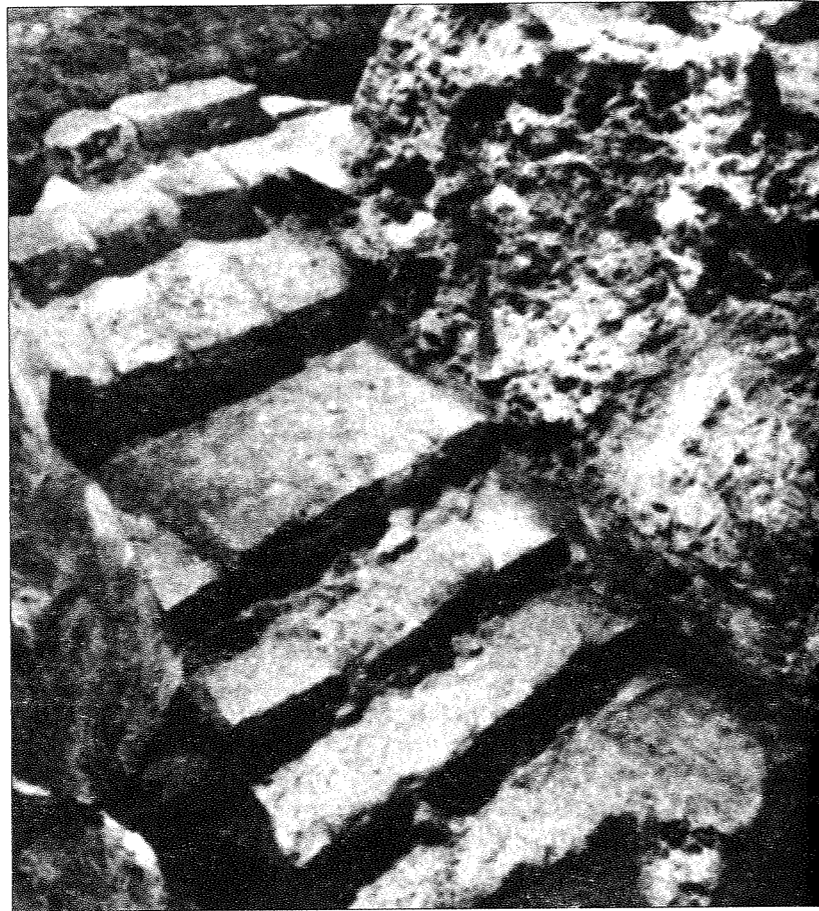
2 pav. Kvadratinio pastato šiaurinės navos senųjų laiptų vaizdas.