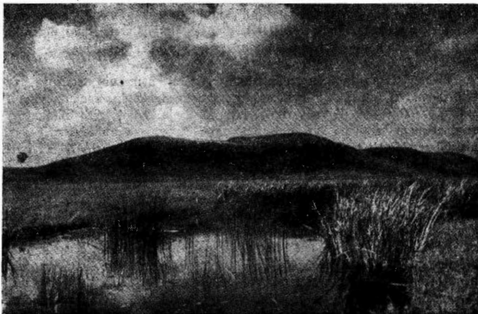
2 pav. Reginėnų piliakalnis iš Daugyvenės upelio puses

dirbamos žemės plotai. Jo rytine papėde teka Daugyvenės upelis. Pietinėje piliakalnio pusėje yra loma, kuri skiria piliakalnį nuo kitos kalvos. Ši kalva turi nuolydį pietų link. Patį piliakalnį vietos žmonės vadina Raganų kalnu, Giliakalniu arba tiesiog piliakalniu, o minėtą kalvą piliakalnio pietinėje pusėje vadina Rinkakalniu, Turgakalniu ar net Bačkirkalniu. Pačiame pietiniame šios kalvos gale, užimančiame apie 0,5 ha žemės plotą, kitados buvo gražių pilkapių grupė, kurios šiuo metu tėra tik kai kurios liekanos.