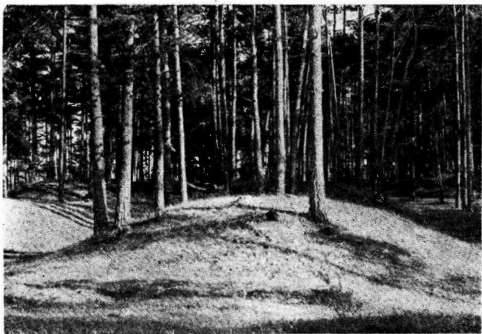
3 pav. Raginėnų pilkapiai pušyne

Prie Raginėnų vietovės yra išlikusios dvi pilkapių grupės. Viena jų piliakalnio pietinėje papėdėje, kairiajame Daugyvenės upelio krante, kita — prie paties kaimo, pušynėlyje (3 pav.), dešinėje vieškelio Seduva—Rožalimas pusėje, apie 1 km į šiaurės rytus nuo piliakalnio. Vietos žmonės čia esančius pilkapius vadina milžinkapiais. Abiejų pilkapynų atskiri pilkapiai skiriasi savo išorine išvaizda ir konstrukcija.