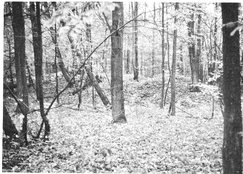
204 pav. Virbalgirie piliakalnis

Piliakalnis įrengtas atskiroje 11 m aukščio statokais, viršuje dirbtinai pastatintais šlaitais kalvoje. Aikštelė beveik apvali, 70x65 m skersmens, su kultūriniu sluoksniu. R ir PV šlaituose, 2-4 m žemiau aikštelės, iškasti 4 m pločio grioviai, už kurių supilti 20 m ilgio, 0,3 m aukščio pylimai. PV šlaite už pirmojo pylimo