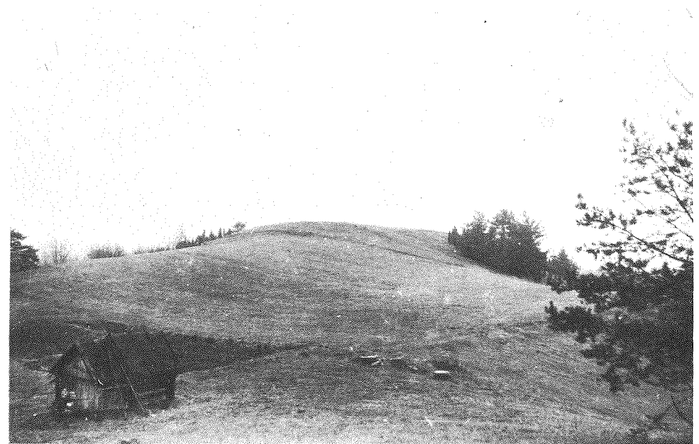
201 pav. Stūglių piliakalnis