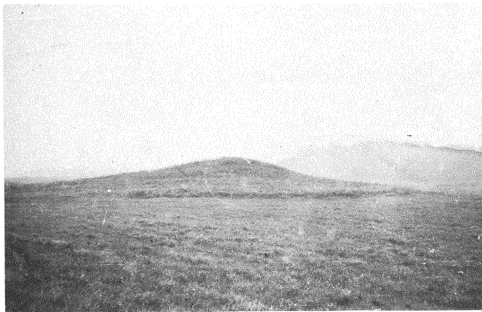
203 pav. Vaitkūnų piliakalnis

Piliakalnis yra 300 m į V nuo Beržininkų kapinių, 300 m į R nuo geležinkelio Vilnius-Daugpilis, 150 m į V nuo kelio