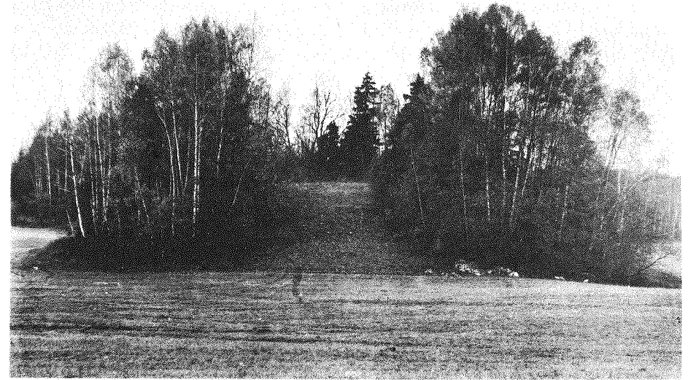
196 pav. Kamšos piliakalnis

Piliakalnis įrengtas atskiroje iki 7 m aukščio statokais šlaitais kalvoje. Aikštelė ovali, pailga PV-ŠR kryptimi, 50x20 m dydžio. Piliakalnio R, Š ir ŠV papėdėse apie 1,5 plote yra papėdės gyvenvietė.