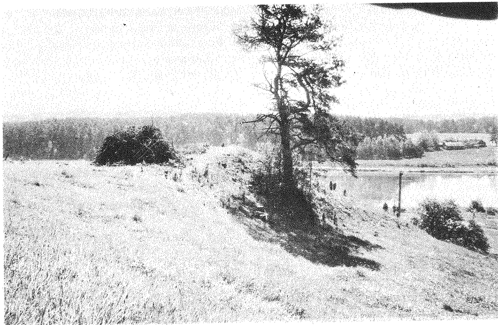
197 pav. Naravų piliakalnis

Grigiškių (Naravų) pilkapyno, Panerių girininkijos miško 36 kv. ŠR kampe, Neries upės kairiajame krante.