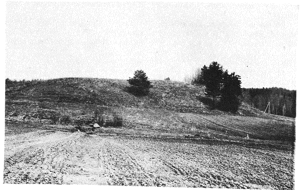
195 pav. Jakaviškių piliakalnis

Piliakalnis yra 1,9 km į Š nuo kelio Ceikiniai-Mielagėnai, 200 m į ŠR nuo kelio Čebatoriai-Dalgedos.