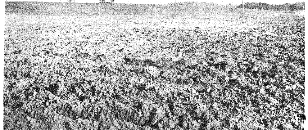
194 pav. Gintarų piliakalnis

Piliakalnis labai apardytas viduramžių dvaro ir ilgalaikio žemės dirbimo.