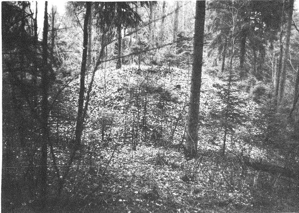
200 pav. Stakliškių piliakalnis

ir Ignalinos rajonuose // Baltų archeologija. 1994. Rugsėjis. Nr. 2. P. 5; Girininkas A. Apie Stajėtiškio aukų akmenį // Liaudies kultūra. 1994. Nr. 3. P. 8.