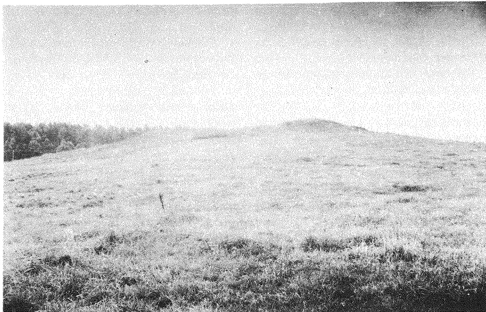
199 pav. Salako piliakalnis

78. SALAKAS , Zarasų raj., Salako apyl. Piliakalnis, vadinamas Puodiakalniu, yra 2,05 km į PR nuo Salako pilkapyno, 1,7 km į ŠV nuo Salako bažnyčios, 220 m į V nuo kelio Salakas-Švedriškė.