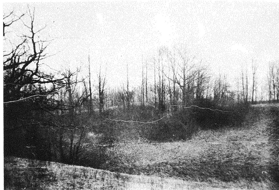
202 pav. Trakinų piliakalnis