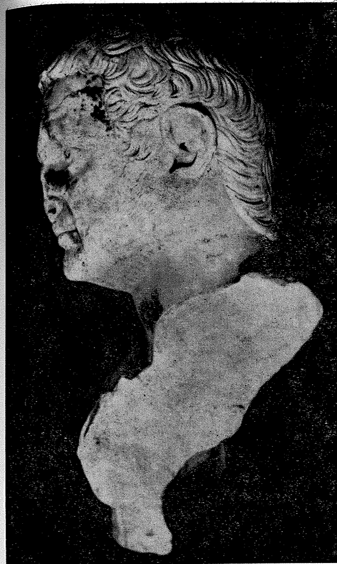
2 pav. Kilmingtono romėno, dėvinčio kario šarvus, skulptūrinis portretas (vaizdas iš šono)

ropai, bet ir jos rytiniams kraštams. Kaip žinoma iš Rusijos caro Petro I laiškų, jo užsakymu Italijoje buvo sukurta nemažai skulptūrų, iš jų ir 24 žymiausių Romos imperatorių bei veikėjų biustai 6 . Buvo perkamos ir atkastos antikinės skulptūros.