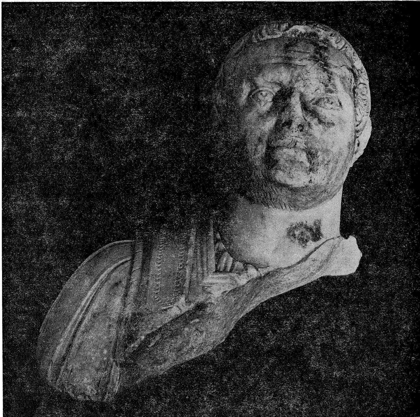
1 pav. Kilmingtono romėno, dėvinčio kario šarvus, skulptūrinis portretas (vaizdas iš priekio)

apleisčių namų rūšiai buvo užpilti griuvenomis ir šiukšlėmis. Panašaus likimo sulaukė ir pastatas, kuriame rastos skulptūrų dalys. Greta marmurinių skulptūrų aptikta ir herbinių koklių fragmentų. Istorikas J. Oksas nustatė, kad šių herbų savininkai Chrapovickiai, Zabelos, gyvenę Rotušės aikštės pietinėje ir vakarinėje dalyse. Tačiau nežinoma iš kurios Senamiesčio vietos skulptūrų fragmentai pateko į tiriamojo kvartalo rūšį. Galima tik spėti, kad rasti dviejų skirtingų skulptūrų fragmentai galėjo patekti iš vienos vietos — XVI—XVII a. egzistavusio rinkinio.