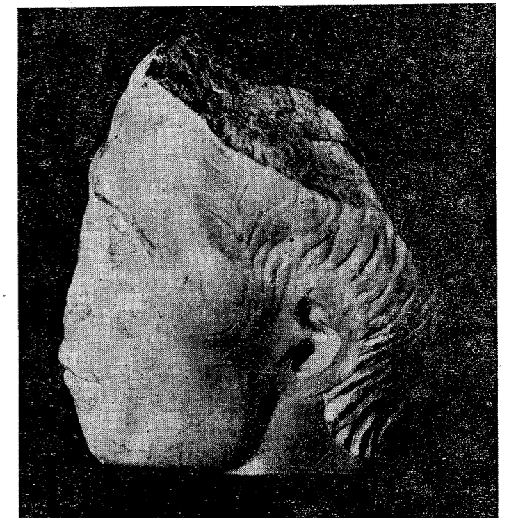
3 ir 4 pav. Pagyvenusio vyro skulptūrinio portreto dalis

gija, pasivadinsi Lenkijos Karalystės ir Lietuvos Didžiosios Kunigaikštystės Nacija (Natio Regni Poloniae et Magni Ducatus Lithuaniae). Draugija rūpinosi ne vien studijuojančiais, bet ir kitais atvykusiais asmenimis: diplomatiniais pasiuntiniais, pirkliais, pilgrimais. Padujos universiteto senajame archyve šios draugijos išlikusiose metrikose per dvidešimties metų laikotarpį (nuo 1592 iki 1612 m.) buvo įrašyti jai epizodiškai priklausę 622 asmenys.