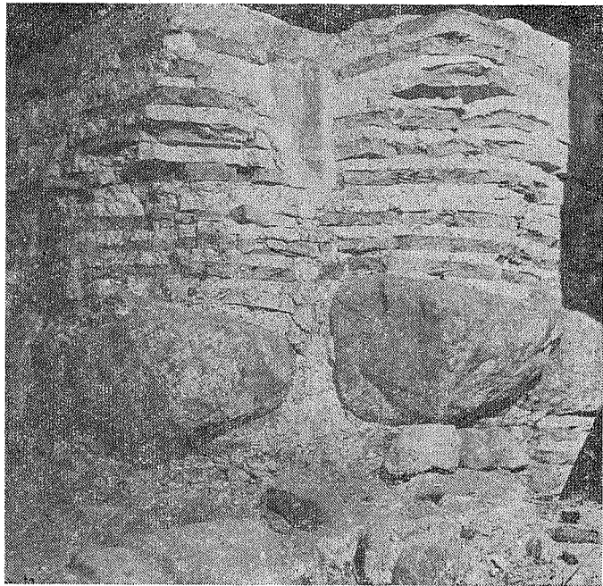
Рис. 1. Кладка Софии XI в.

Далее К. Шероцкий сообщает, что обнаружены восьмигранный столб напротив главной апсиды, пилястры, сохранившиеся на западных и восточных фасадах, а также остатки первоначального входа в храм, расположенного в южной стене. Ширина входа одна сажень и пять вершков. Дается подробное описание кладки стен собора, которая позднее получила название «кладки со скрытым рядом». Он также отмечает, что древний пол Софии, выложенный продолговатыми шестиугольными плитками на известковом растворе, находился на глубине 1,5 аршина от современного пола. К сожалению, П. П. Покрышкин не опубликовал результаты своих наблюдений и раскопок, произведенных в 1909—1913 гг. Видимо, по этим материалам К. Шероцкий предложил свою рекон-